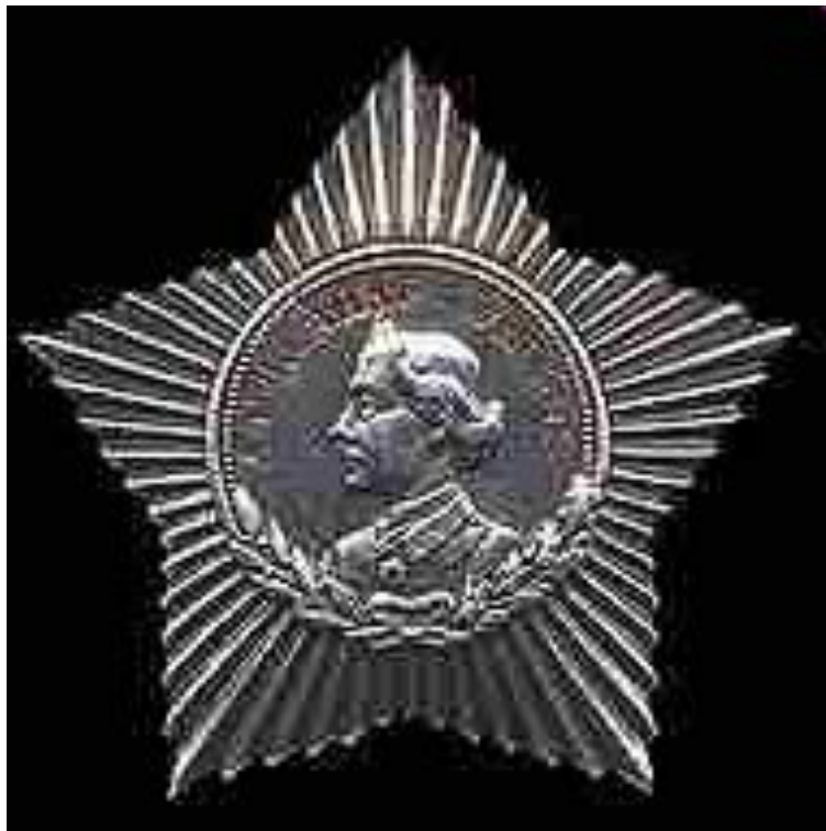
Орден Суворова III степени