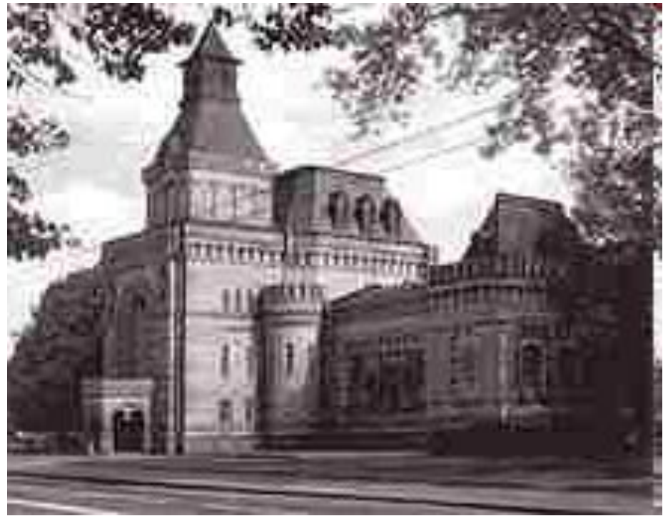
Мемориальный музей Суворова в Санкт-Петербурге