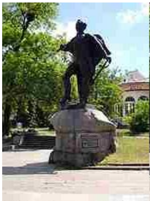
Памятник Суворову на месте редута на берегу Салгира