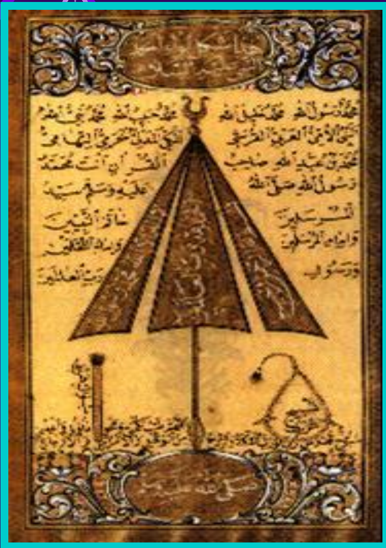
Сунна.Рукопись 8 в.

Шииты призвали народ к Свержению Омейядов. Вскоре восстали Иран и Средняя Азия.