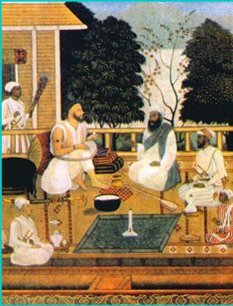
Миниатюра из «1000 и одна ночь».

Расцвет халифата пришелся на правление Халифа Харун ар-Рашида-героя «1000 и 1 ночи», где он показан мудрым и справедливым политиком.