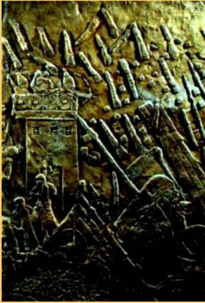
Осада Лахиша. Рельеф из дворца царя в Ниневии

Стены библиотеки украшались барельефами изображавшими подвиги царей.