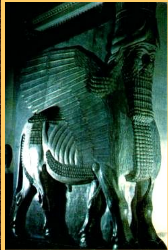
Статуя бога-шеду из дворца Саргона II в Дур-Шаррукине.

При царе Ашшурбанипале была собрана большая библиотека в царском дворце. В ней хранились вавилонские и ассирийские мифы и предания и астрономические трактаты записанные на глиняных табличках. Ассирийцы могли различать светила и созвездия.