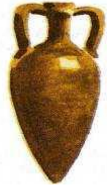
Амфора – сосуд Для вина и масла