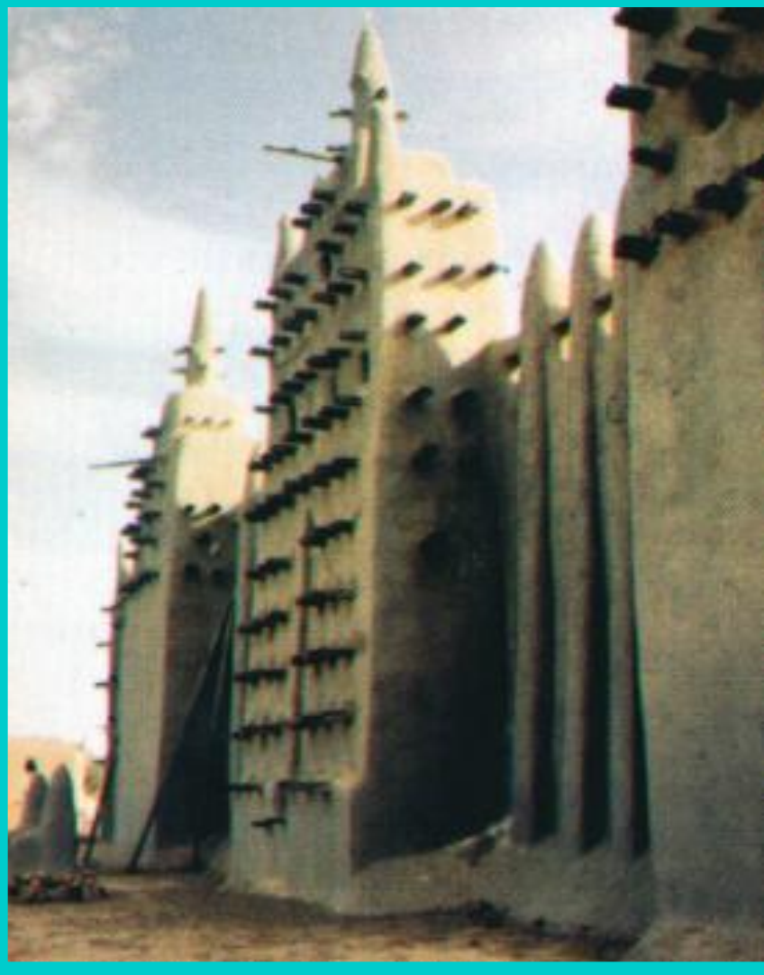
Мечеть в Дженне.

В 15 в. окрепло государство Сонгаи. Али Бер построил мощный речной флот и присоединил Дженне и Томбукту. Приняв ислам, он построил несколько мечетей. В Сонгаи складывались феодальные отношения, но в 16 в. государство ослабло.