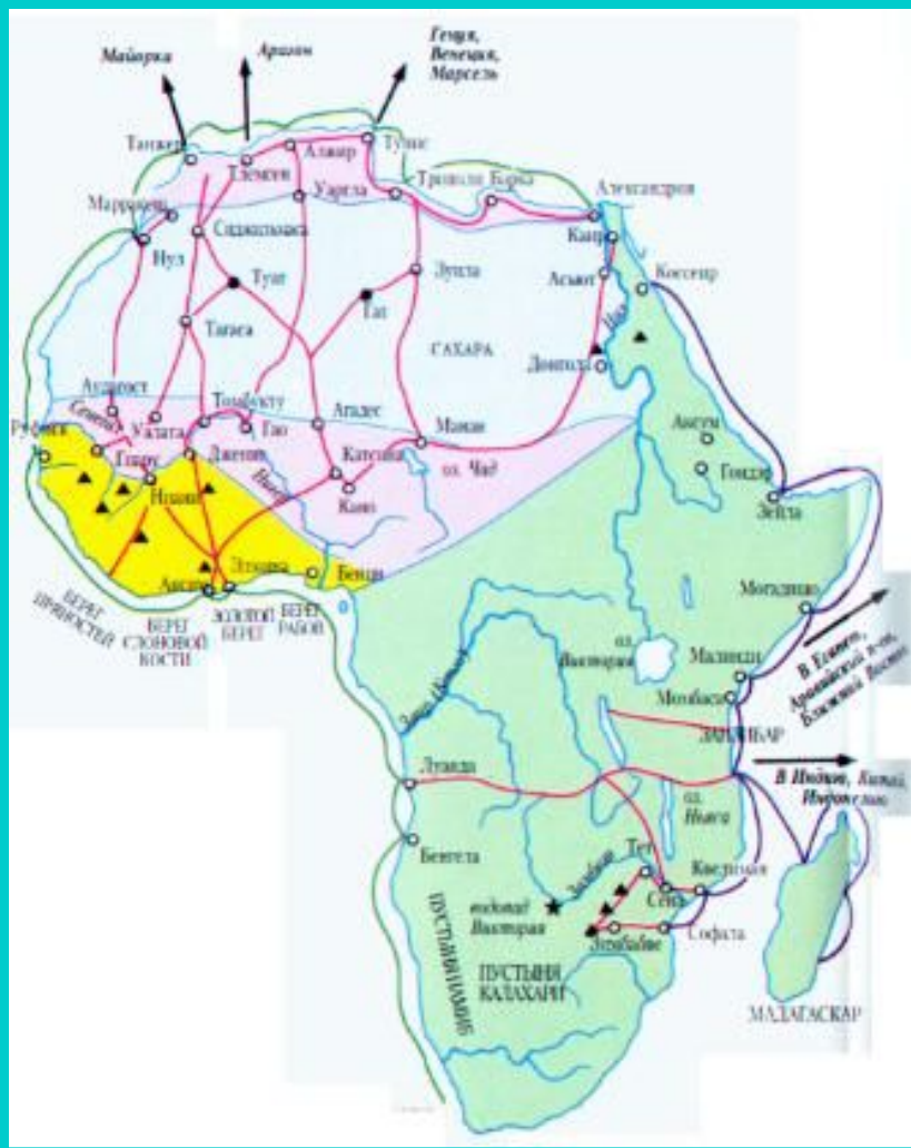
Торговые пути Африки.

На территории Африканского рога в 4-5 веках существовало государство Аксум. Оно торговало с Римом и Византией. Знать Аксума приняла христианство.