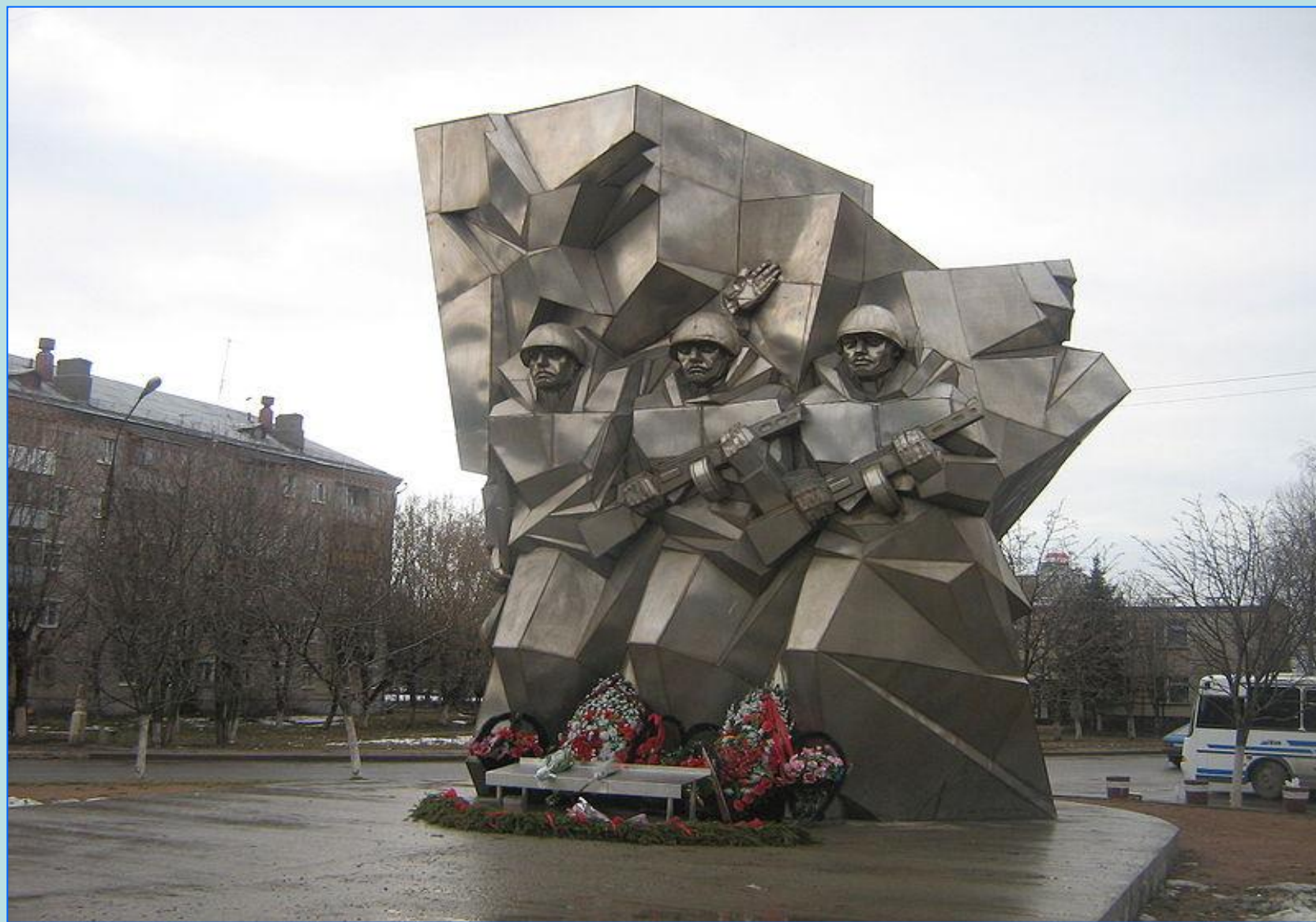
памятник курсантам подольских училищ