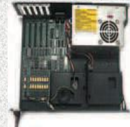
Блок питания IBM PC/XT

Схемотехника тех, первых питальников была весьма близка к современной. Помимо стандартных молексов, они имели разбитую на две части колодку, предназначенную для подключения БП к материнской плате. Чуть позже, с выходом 286 процессора и платформы AT (Advanced Technology) в 1984 году и ее модификации Baby AT – в 1995, появилась новая модификация блоков питания с соответствующим названием.