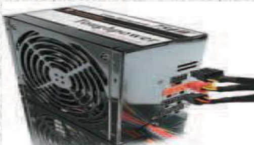
Модульный блок питания Thermaltake.