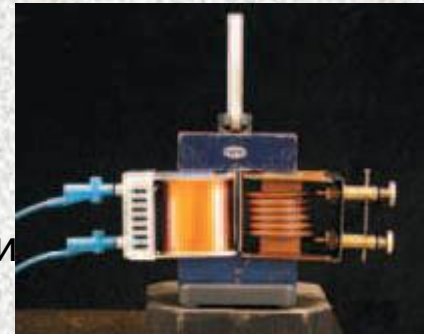
Трансформатор весит немало.

Блоки питания первых компьютеров представляли собой целые подстанции. Для получения требуемых напряжений использовались огромные трансформаторы с сердечником из стальных пластин и медными обмотками.