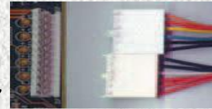
Колодки питания AT

Блоки нового поколения были разработаны как замена устаревшему стандарту AT в 1995 году. Многие производители долго не прекращали производство плат AT/ATX, которые можно было подключать как к старым, так и к новым блокам питания.