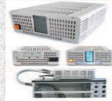
Nesteq Nova 600W External Silent PSU.

В конце 2000 года на материнских платах формата ATX появились дополнительные разъемы. В новых блоках питания появился дополнительный четырехпиновый коннектор на 12 вольт, а на маркировке блоков – гордая надпись «P4 ready!». Несколько позже вышел SATA, и в питальниках начали появляться разъемы питания этого стандарта.