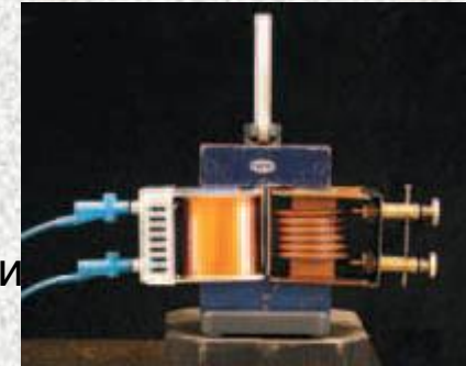
Трансформатор весит немало.

Блоки питания первых компьютеров представляли собой целые подстанции. Для получения требуемых напряжений использовались огромные трансформаторы с сердечником из стальных пластин и медными обмотками.