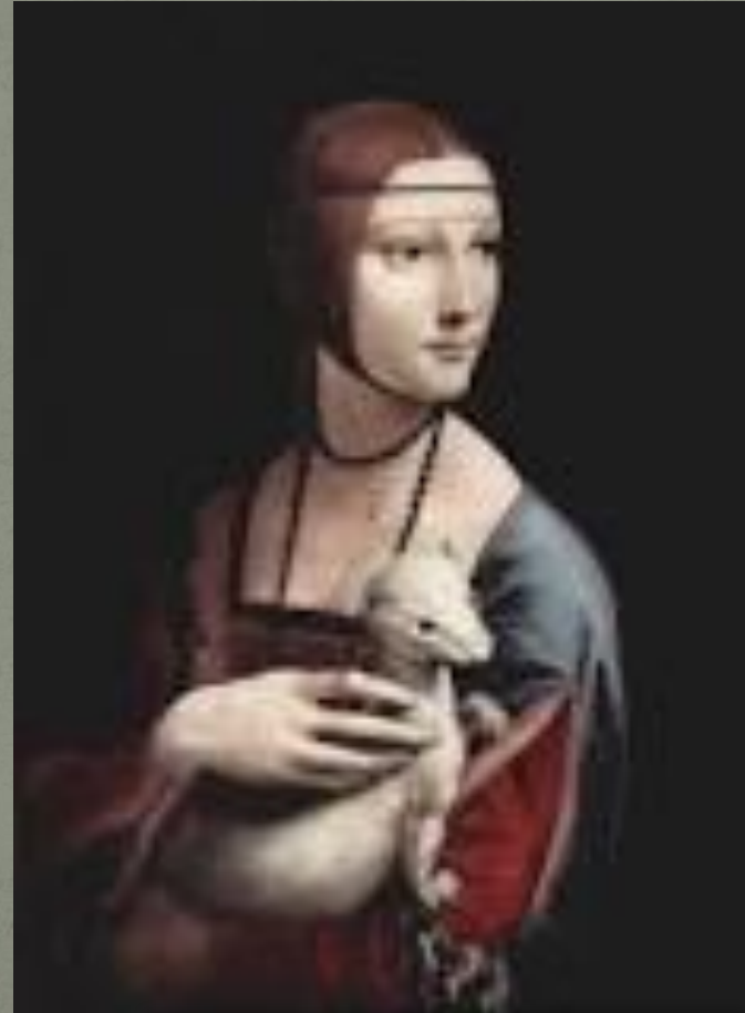
Дама с горностаем

Портрет Чечилии Галлерани (Дама с горностаем) написан в 1485 году. Из тёмного фона выступает фигура женщины с символическим зверьком на руках. Поворот лица, освещённое плечо и положение тела грациозного маленького хищника придаёт живость картине. Мы замечаем психологическую параллель – сравнение животной грации, мнимой прирученности и скрытого неповиновения, общих для женщины в её руках.