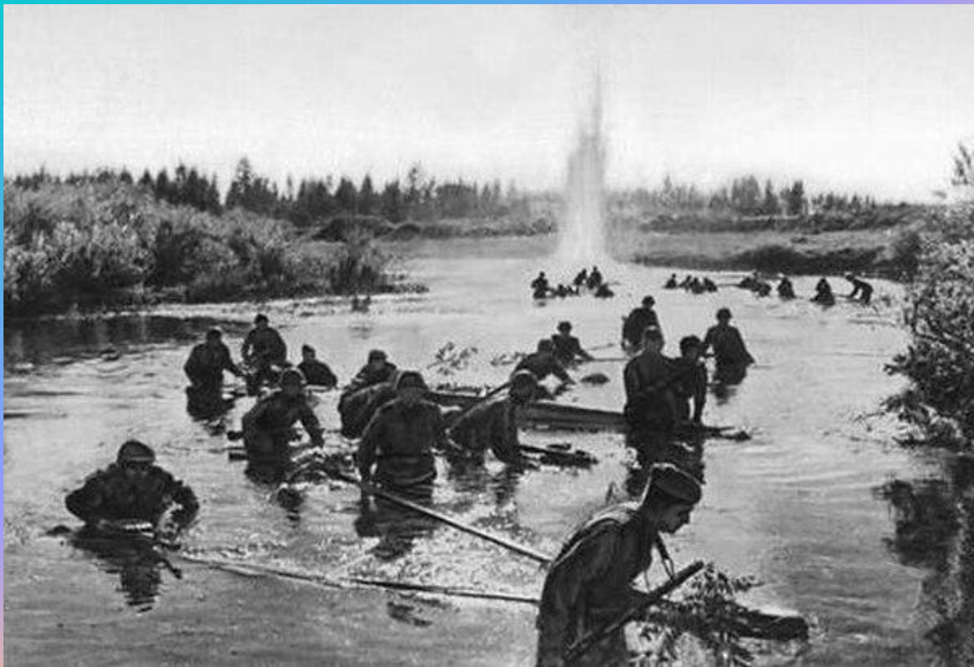
Форсирование Днепра 1943 г.

В годы Великой Отечественной войны гидрологи помогали преодолевать водные рубежи, болота.