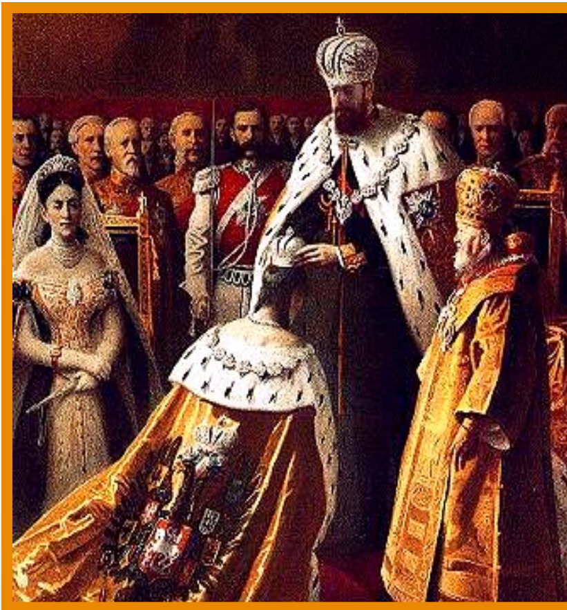
Коронация Александра III.

Александр III взял руководство внешней политикой в собственные руки. Ему помогал министр иностранных дел Н. Гирс. Важнейшие посты в министерстве сохранили дипломаты горчаковской школы.