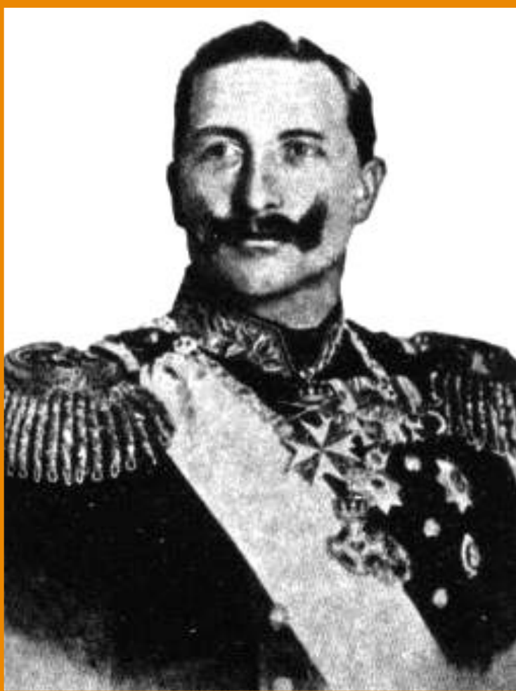
Германский император. Вильгельм I.

В 1887 г. отношения Германии и Франции обострились и лишь вмешательство Александра III, предотвратило войну. В ответ Германия начала таможенную войну.