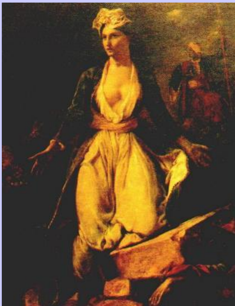
Э.Делакруа. Греческая революция

В к. 20-х г. Союз распался из-за противоречий по Восточному вопросу.