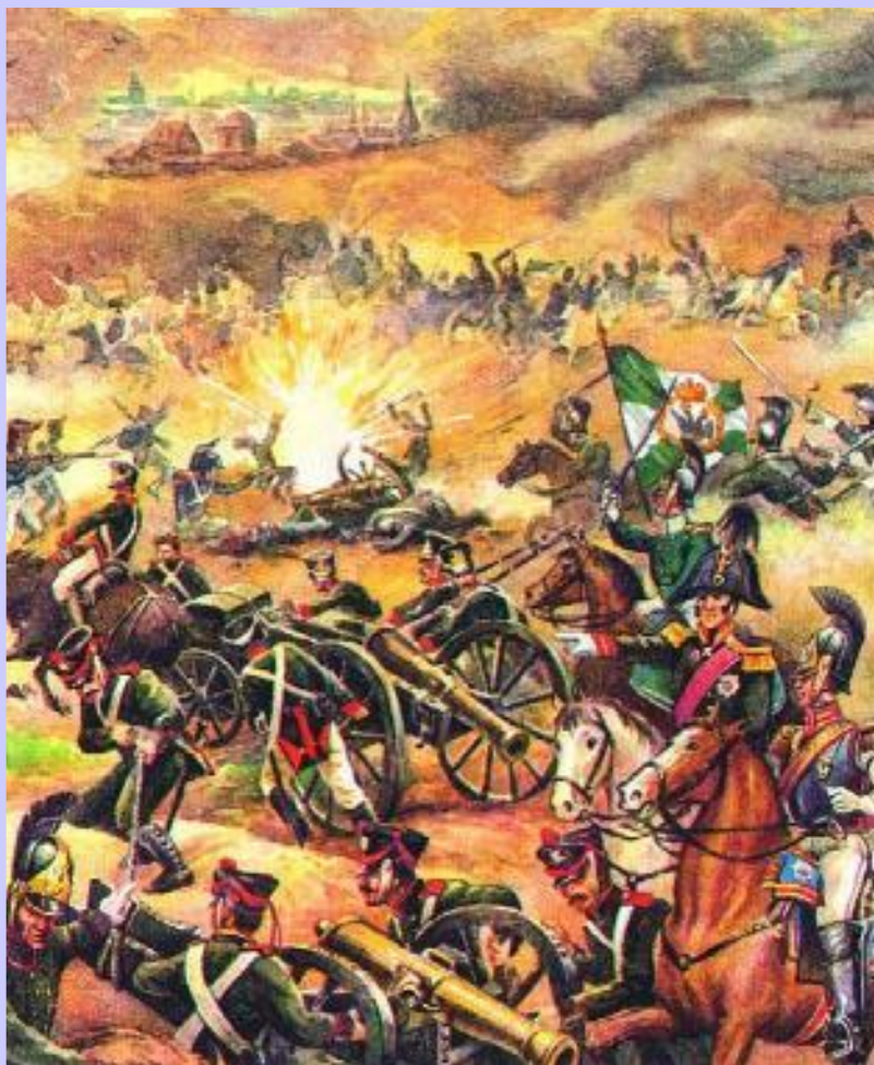
«Битва народов» под Лейпцигом.

Наполеон в это время собрал новые войска и в к. апреля нанес союзникам поражения при Люцене и Бауцене и заключил перемирие.