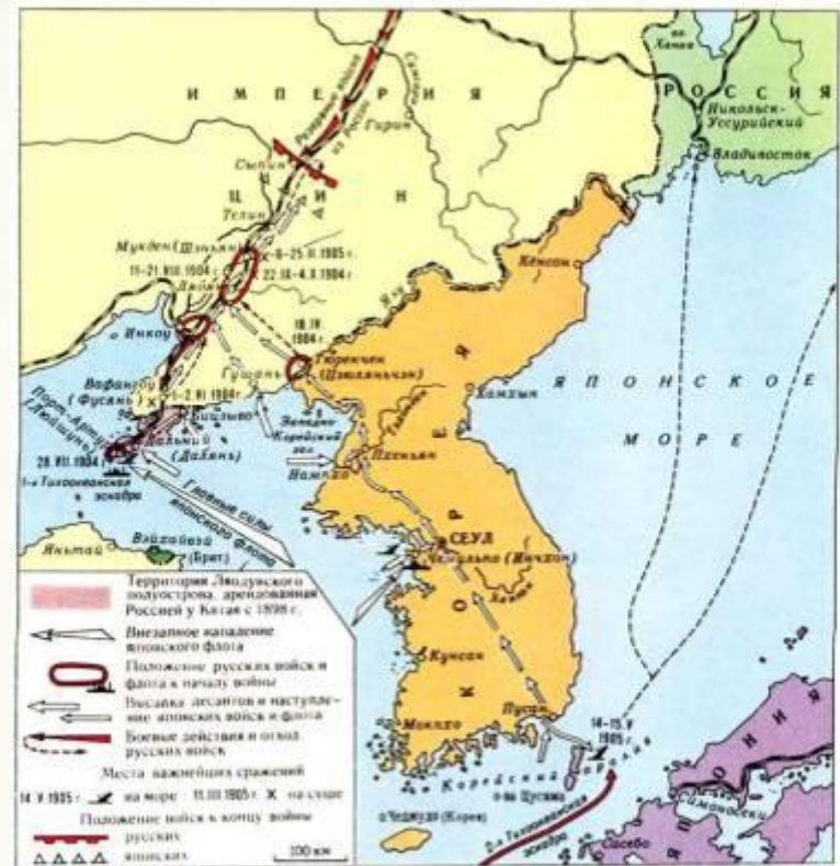
Русско-Японская война 1904-1905 гг.