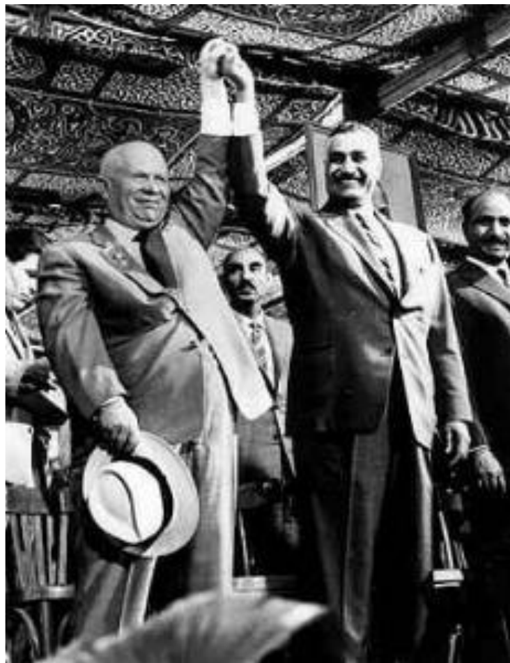
Н.С.Хрущев и Г.А.Насер.

Укреплялись отношения со странами-лидерами Движения-Индией, Индонезией, Египтом. Их руководители нанесли визиты в СССР, им оказывалась военная и экономическая помощь. СССР поставлял оружие в страны Азии, Африки, Латинской Америки. При его поддержке Египет национализировал Суэцкий канал, Индонезия освободила о. Тимор. В ответ США начали поддержку Израиля и Пакистана. Это привело к новым конфликтам.