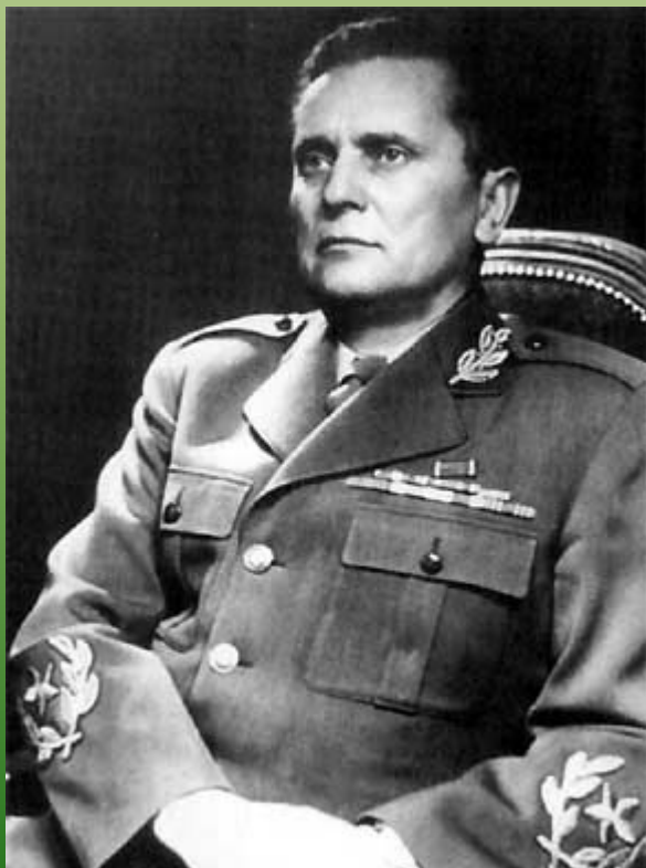
Иосип Броз Тито. 1945 год

начал борьбу с оппортунизмом в партиях Восточной Европы. Их лидеры были объявлены врагами а отношения с Югославией были разорваны.