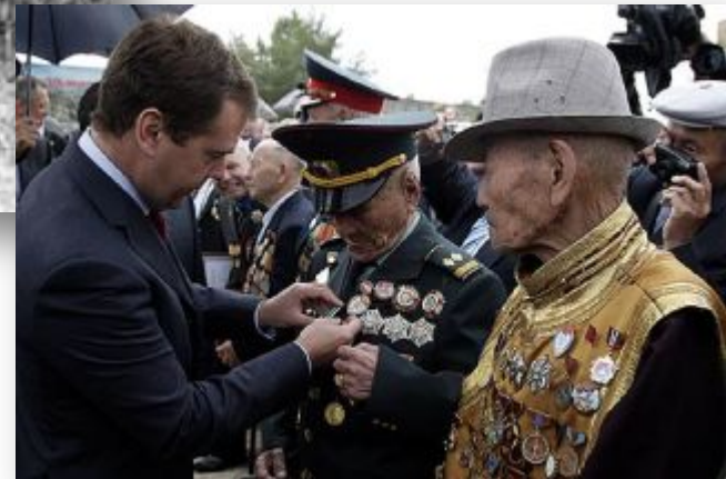
Д. А. Медведев вручает российские награды ветеранам Халхин-Гола (Улан-Батор, 2009)