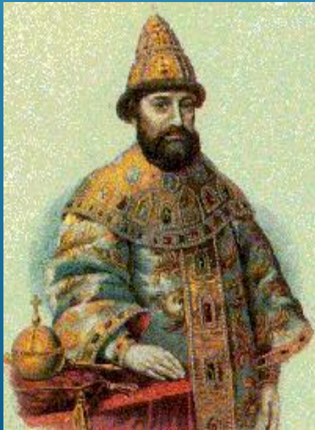
Фёдор I Иоаннович 1584 — 1598