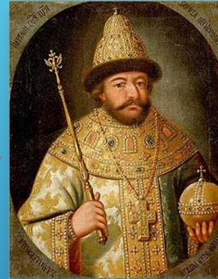
Борис Годунов 1598 — 1605