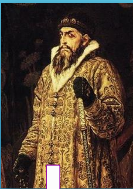
Иван IV Васильевич Грозный 1547 — 1584