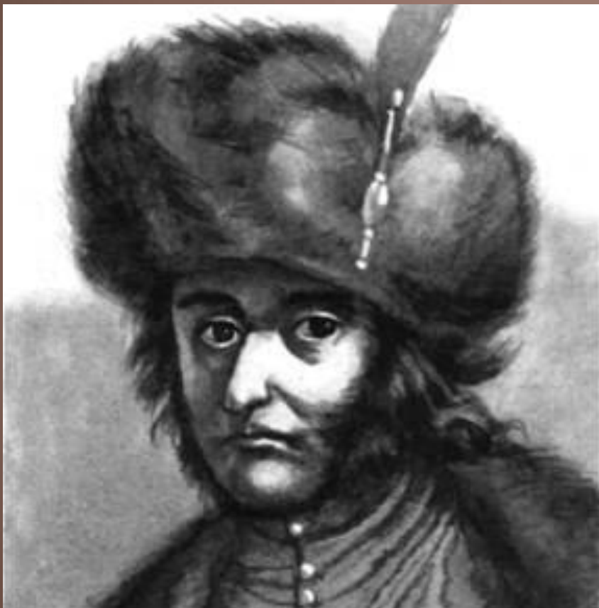
Лжедмитрий I – Григорий Отрепьев

Самозванец на самом деле происходил из мелких дворян, служил у бояр Романовых, а после ссылки постригся в монахи в Чудовом монастыре