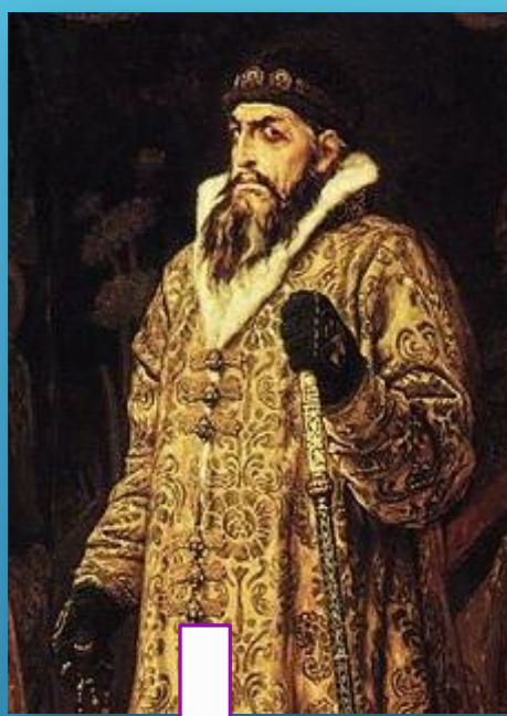
Иван IV Васильевич Грозный 1547 — 1584