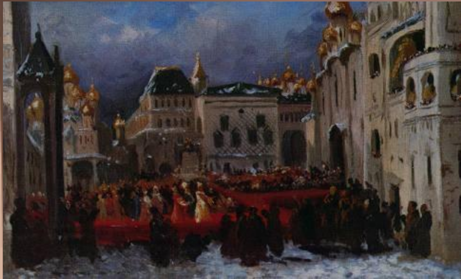
Москва времён Б. Годунова

С 1601 по 1603 годы были неурожайными, даже в летние месяцы не прекращались заморозки, а в сентябре выпадал снег. Разразился страшный голод, жертвами которого стало до полумиллиона человек. В Москве голод был особенно страшным