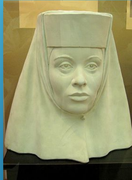
Ирина Годунова 1598 — 1598