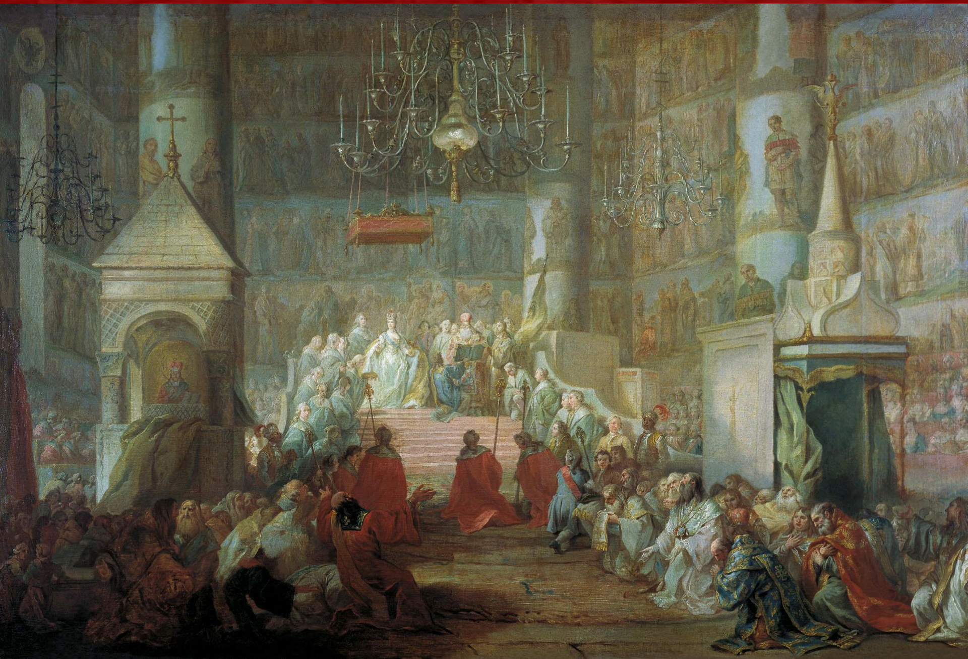
Коронация Екатерины II Торелли Стефано (1712-1780)