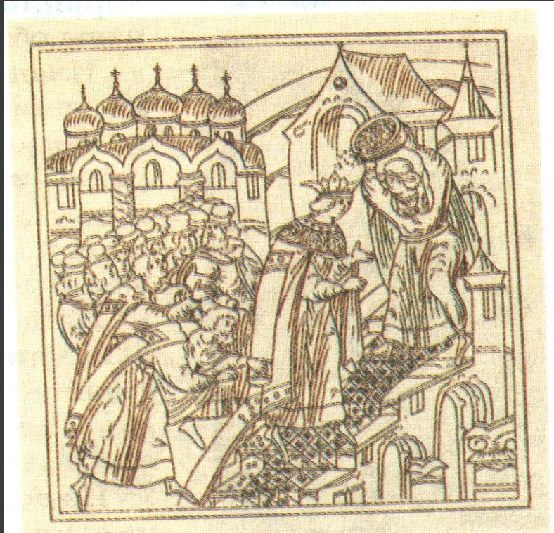
Обряд осыпания золотыми монетами царя Ивана IV после венчания на царство. Миниатюра.