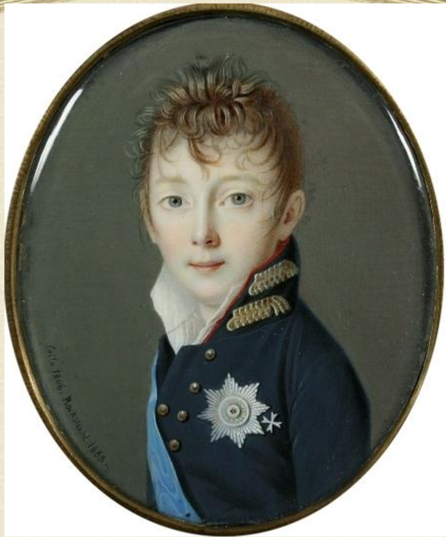
Николай I в детстве. А. Рокштуль