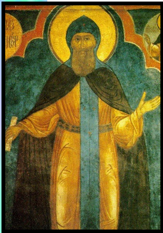
Великий князь Даниил. Фреска Успенского собора Кремля.

Острейшая борьба в н. 14 века развернулась между Москвой и Тве- рью.