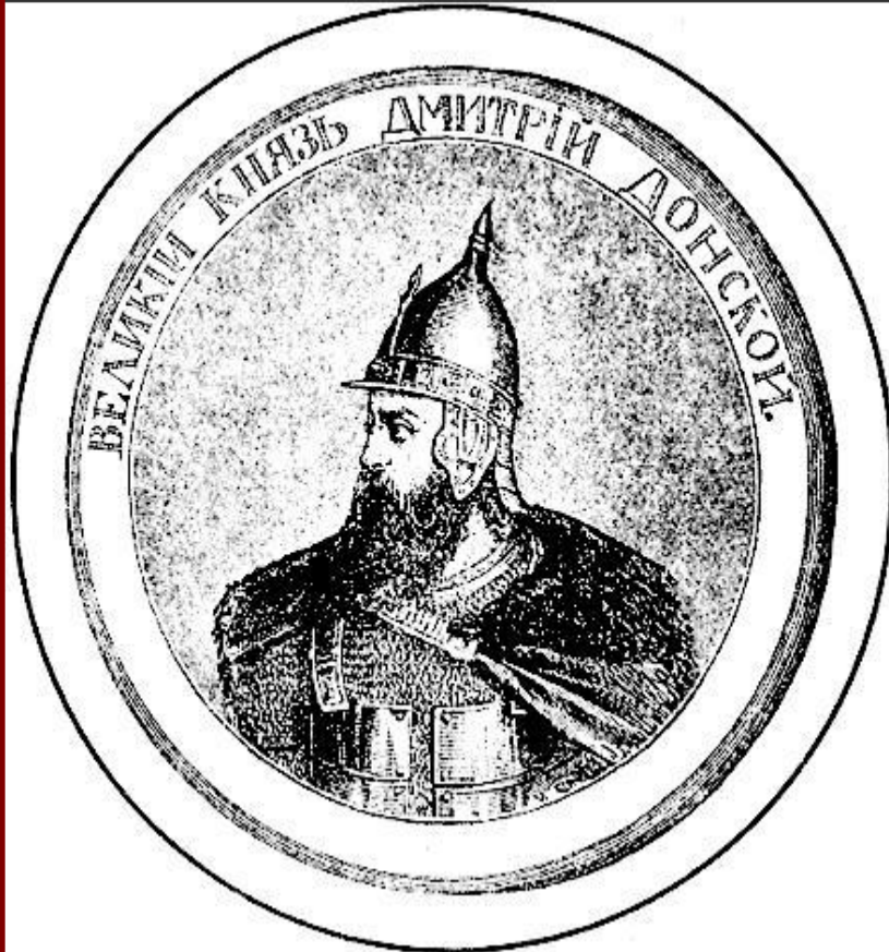
Великий князь Дмитрий. Гравюра XIX в.

В 1375 г. Дмитрий подошел к Твери и тверской князь признал себя «Молодшим братом».