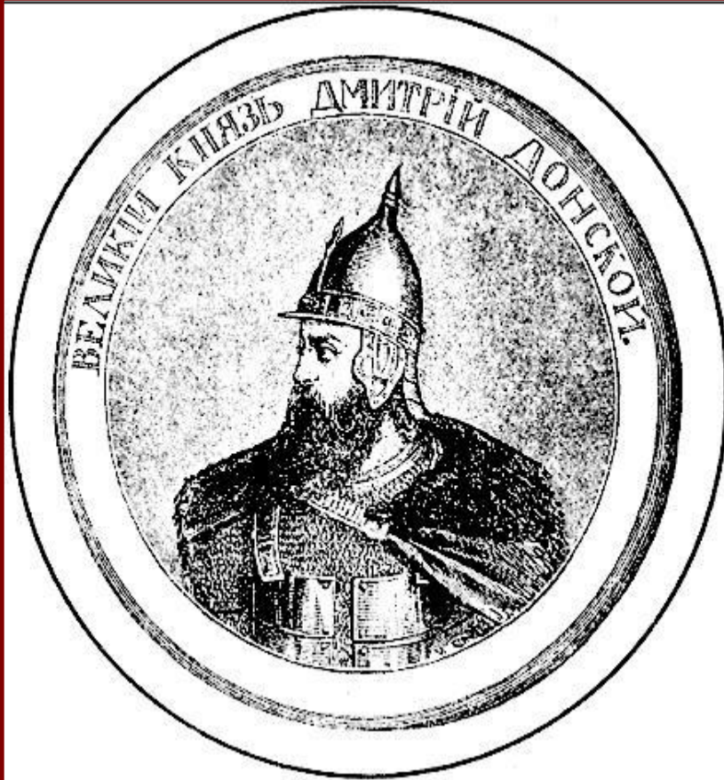
Великий князь Дмитрий. Гравюра XIX в.

В 1375 г. Дмитрий подошел к Твери и тверской князь признал себя «Молодшим братом».