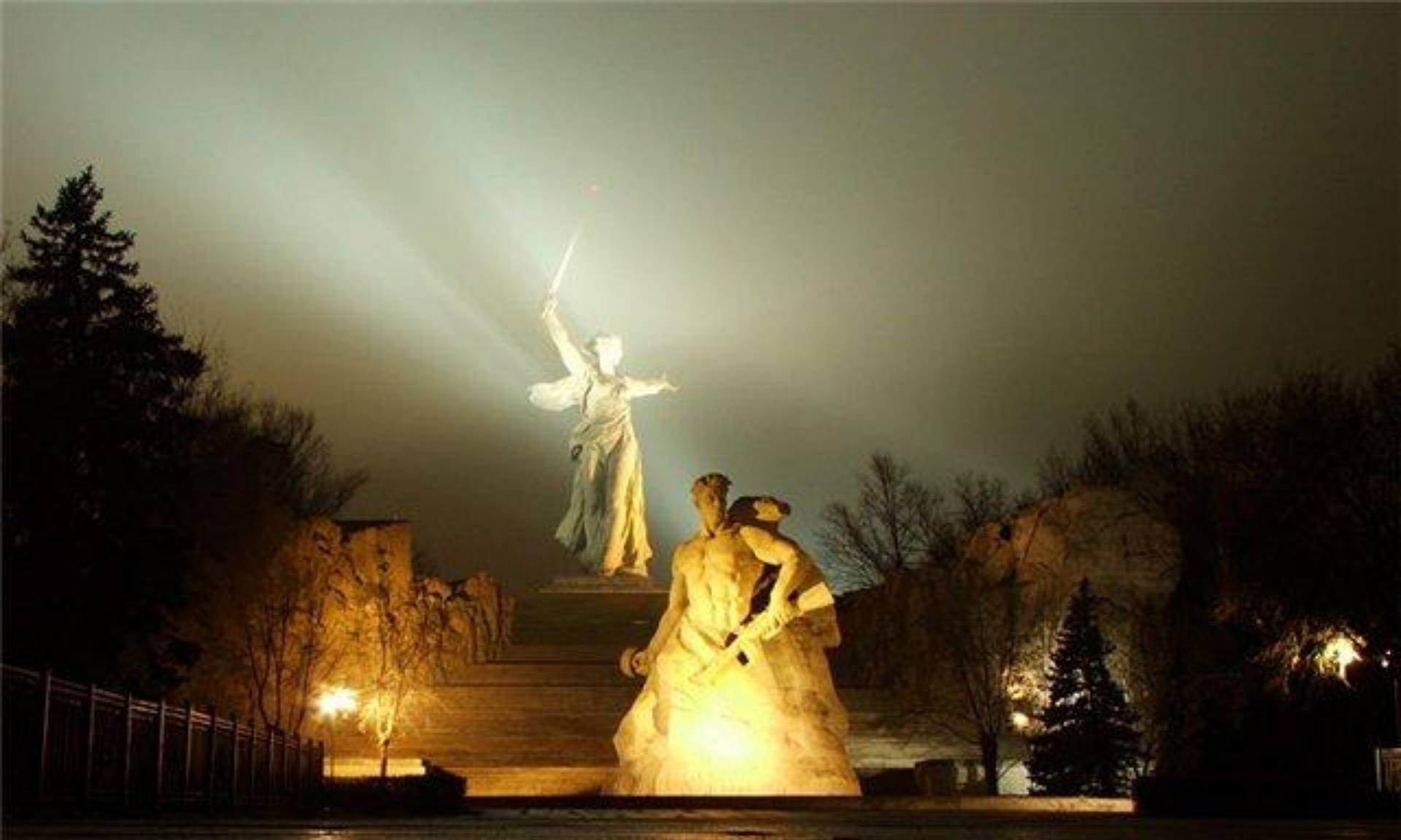
Мамаев курган. Волгоград