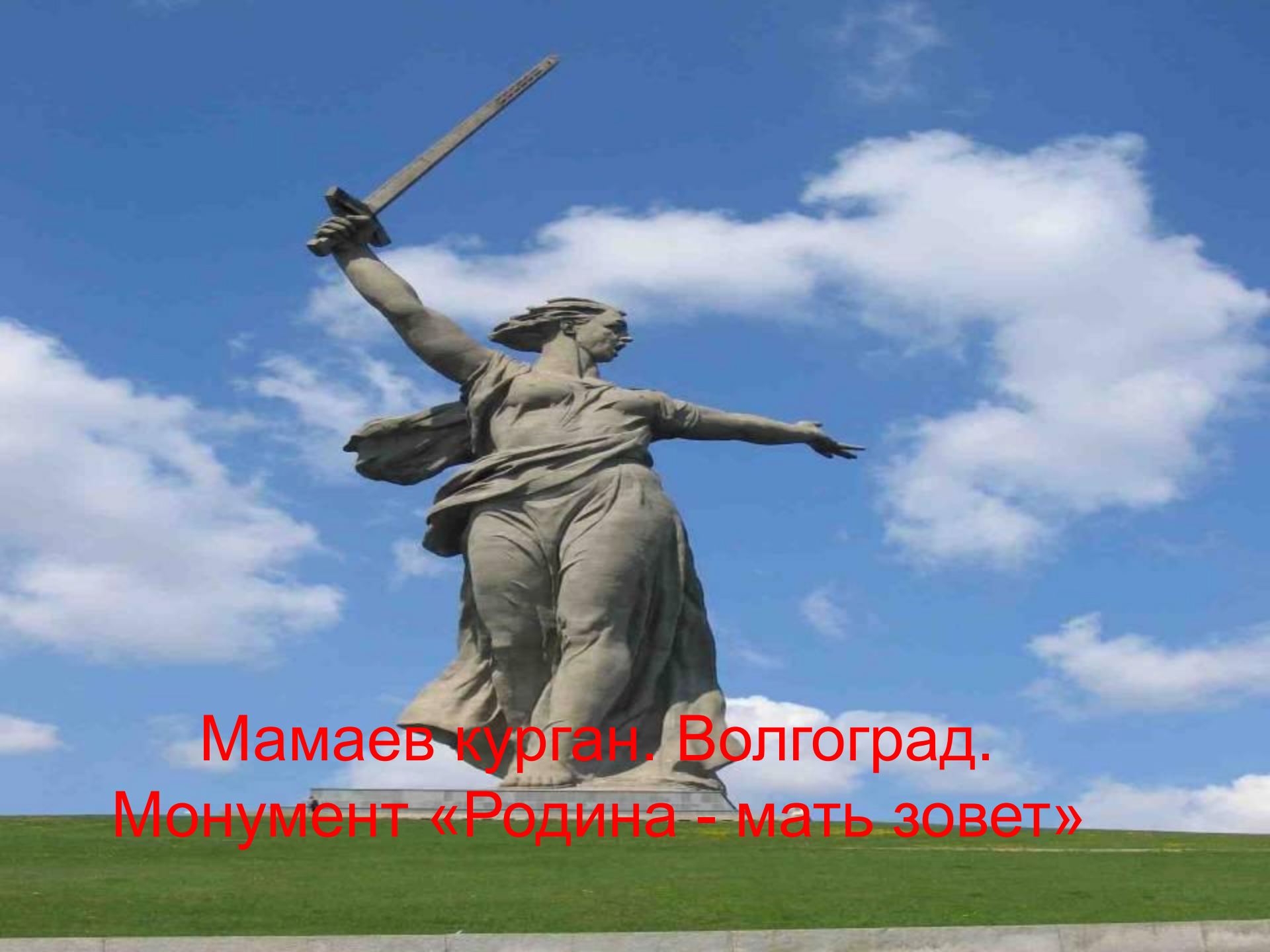
Мамаев курган. Волгоград. Монумент «Родина - мать зовет»