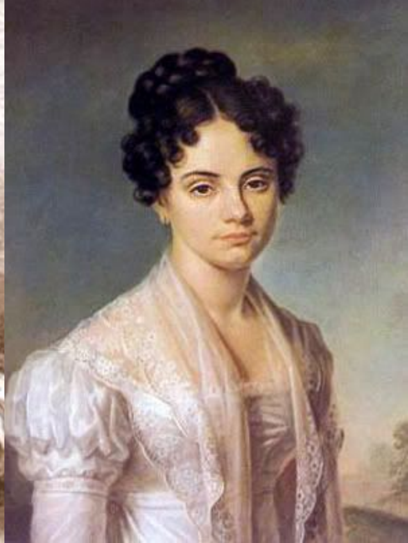
МАРИЯ ВОЛКОНСКАЯ (ЖЕНА)