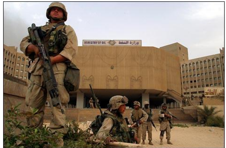
Солдаты США в центре Багдада

К 10 апреля общие американские потери составляли 108 убитых. Собственно во время штурма Багдада было потеряно несколько десятков убитыми и ранеными, сбит штурмовик А-10 (пилот спасся). Подбиты несколько танков и БМП. Во время штурма и предшествующей авиационной подготовки Багдад пострадал несильно, поскольку использовалось почти исключительно высокоточное оружие. Население Багдада во время авиаударов не пряталось в убежища, поскольку на опыте убедилось, что американцы воздерживаются от огульных огневых ударов по площадям.