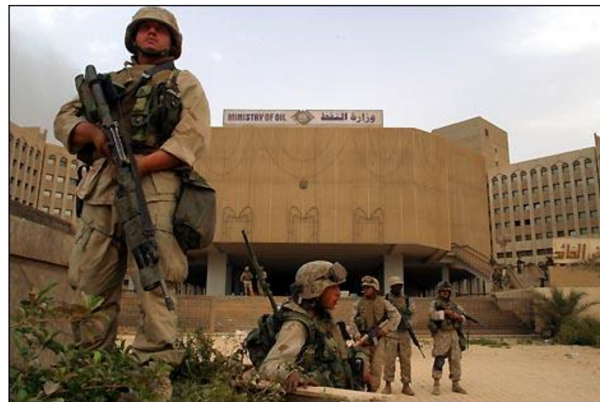
Солдаты США в центре Багдада

К 10 апреля общие американские потери составляли 108 убитых. Собственно во время штурма Багдада было потеряно несколько десятков убитыми и ранеными, сбит штурмовик А-10 (пилот спасся). Подбиты несколько танков и БМП. Во время штурма и предшествующей авиационной подготовки Багдад пострадал несильно, поскольку использовалось почти исключительно высокоточное оружие. Население Багдада во время авиаударов не пряталось в убежища, поскольку на опыте убедилось, что американцы воздерживаются от огульных огневых ударов по площадям.