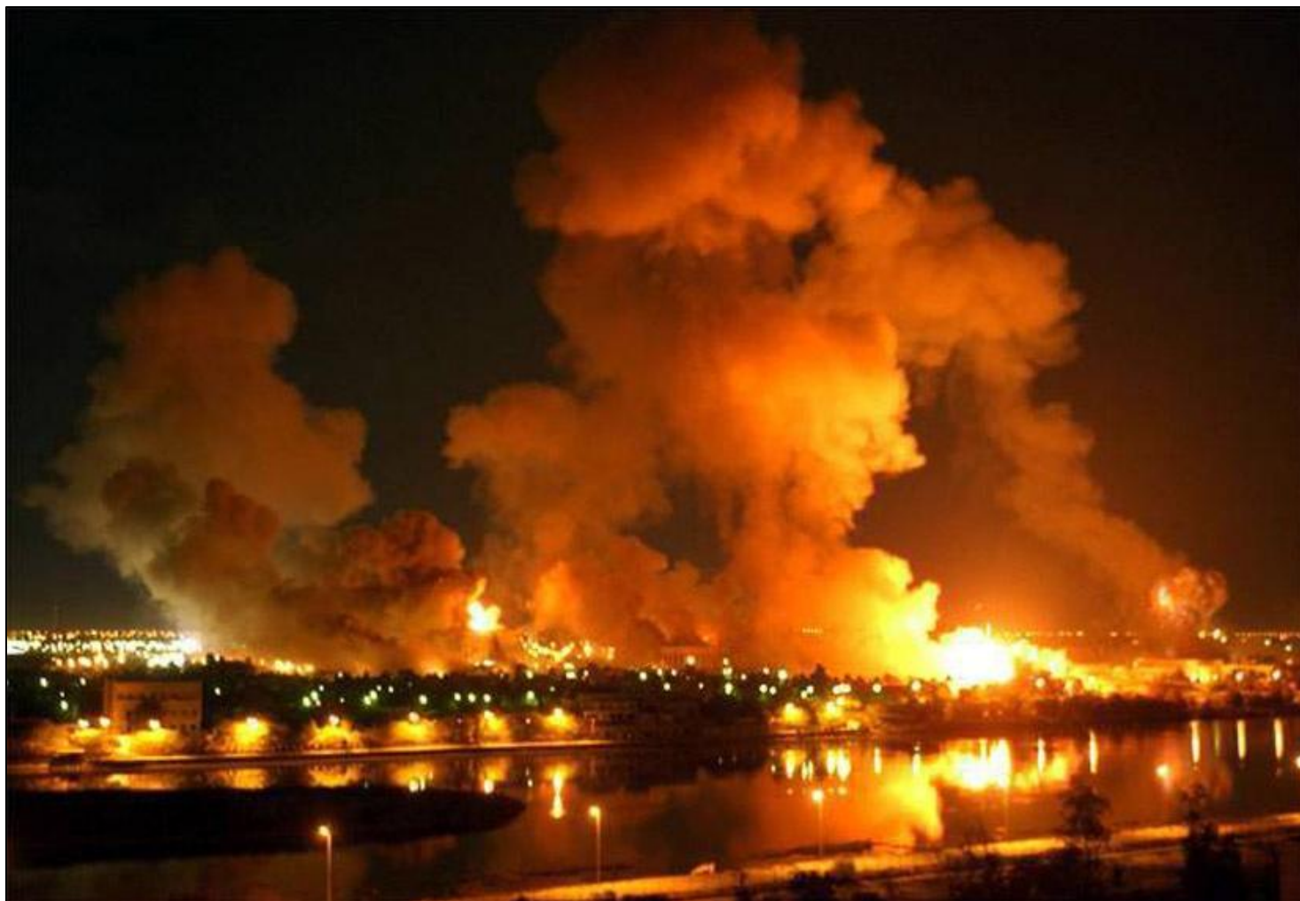
Дым поднимается от здания иракского министерства планирования в Багдаде после того, как в него попала ракета в начале войны в Ираке 20 марта 2003 года.