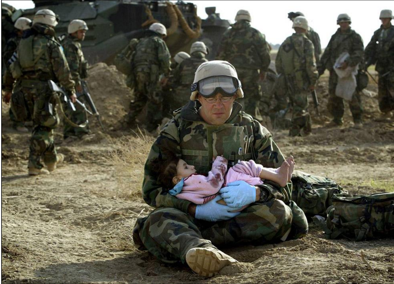
Врач морской пехоты держит на руках иракскую девочку в центральном Ираке 29 марта 2003 года. Когда местные солдаты начали вытеснять гражданских жителей в сторону позиций морских пехотинцев, перекрестный огонь на линии фронта разбил иракскую семью.