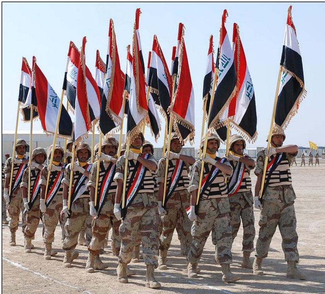
Солдаты 14-й дивизии иракской армии на церемонии, посвящённой завершению обучения в Центре боевой подготовки в Бисмайе. 13 февраля 2008 года