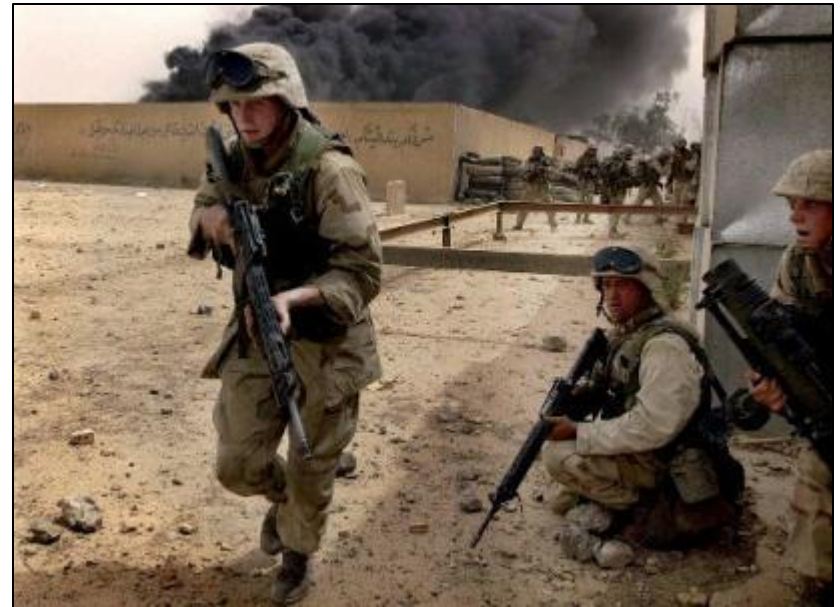
Бои в Басре