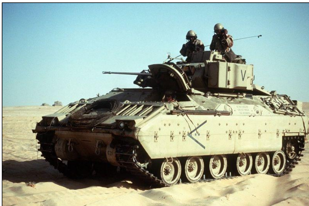
БМП М2 "Бредли"