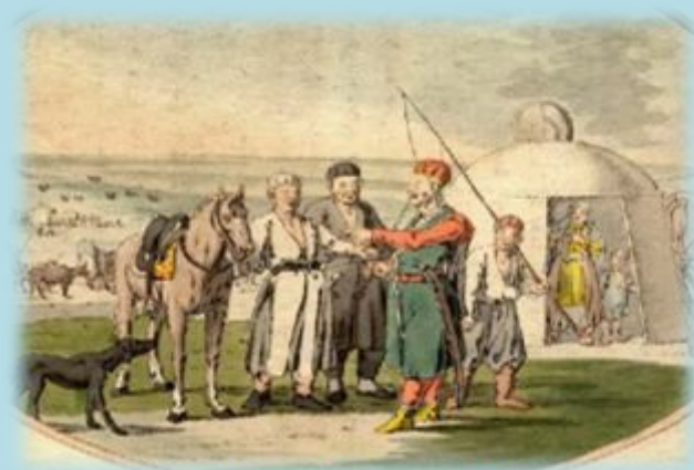
Татары, башкиры и др. нерусские народы России