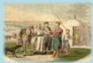
Татары, башкиры и др. переселенные народы России