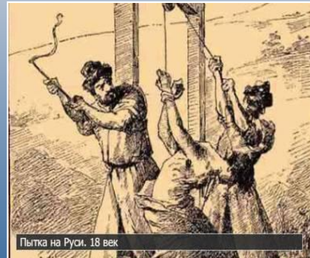
Пытка на Руси. 18 век