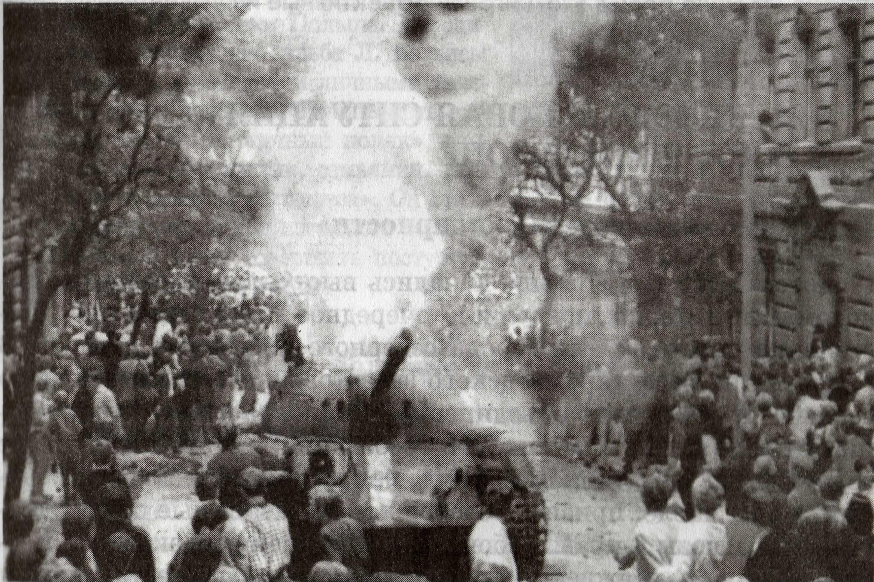
Прага. Август 1968 г.