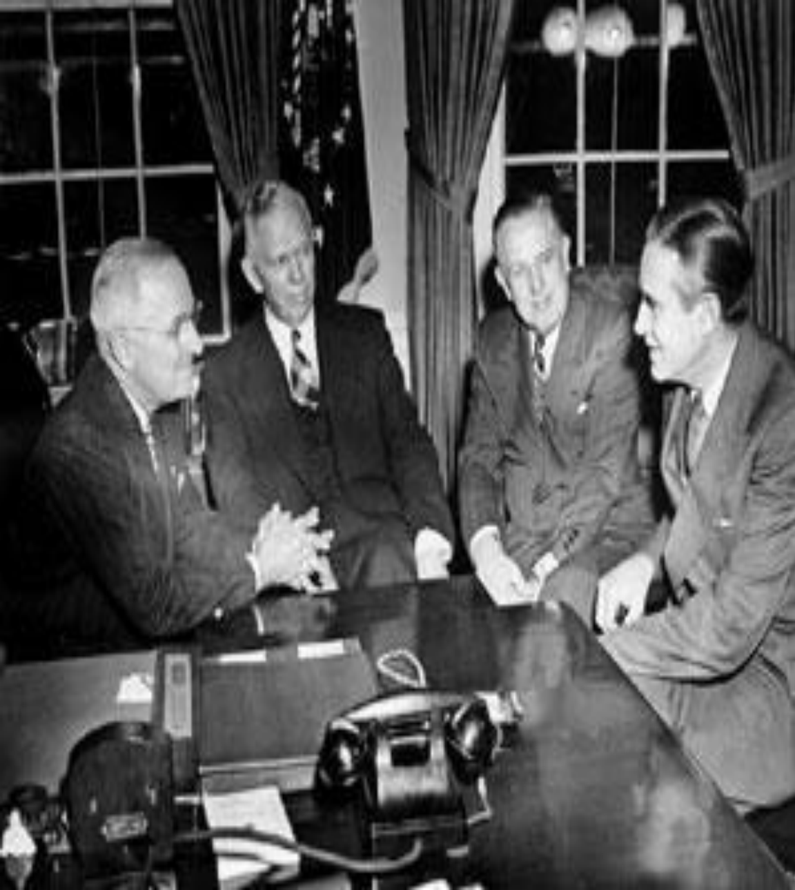
Архитекторы плана Маршалла обсуждают ход восстановления Европы в Белом доме,

Наиболее значительным актом западных оккупационных властей, приведшим к окончательному расколу Германии, была денежная реформа 20 июня 1948 г. В это же время началось подключение Западной Германии к помощи по "плану Маршалла". В политической жизни судьбоносным было решение о создании Парламентского совета по выработке конституции для западных зон Германии. Совет утвердил проект Конституции, по которой в западной части Германии создавалось государство с демократической формой правления и рыночной