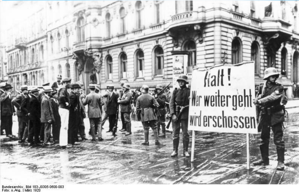
März 1920

Капповский путч в марте 1920 года стал для республики первым серьёзным испытанием на прочность.