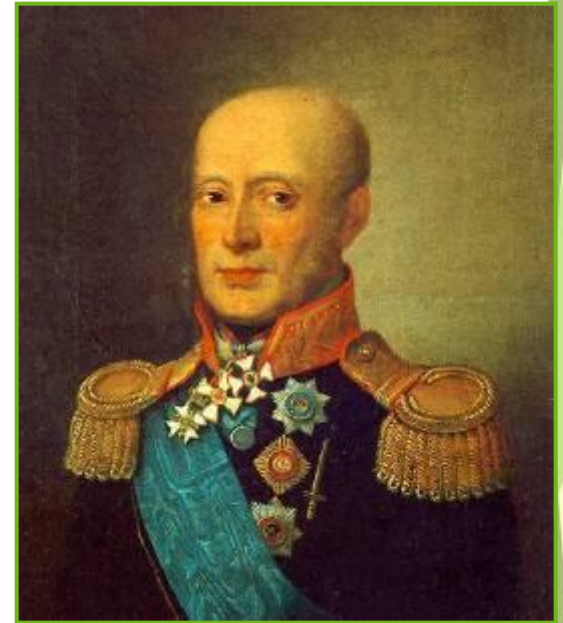
Михаил Богданович Барклай-де-Толли (1761 - 1818)

Генерал-фельдмаршал, князь. Он был участником русско-турецкой 1787 - 1791 гг. и русско-шведской 1788 1790 гг. войн. В войне с Францией 1806 - 1807 гг. и русско-шведской войне 1808 - 1809 гг. командовал дивизией и корпусом. В 1810 - 1812 гг. - военный министр России. В ходе Отечественной войны 1812 г. возглавлял 1-ю Западную армию. В Бородинском сражении командовал правым крылом и центром русских войск, а в заграничных походах 1813 - 1814 гг. возглавлял объединенную русско-прусскую армию. Успешно руководил ею в сражениях под Торном, Кульмом и Лейпцигом. М.Б. Барклай-де-Толли родился 16 декабря 1761 г.