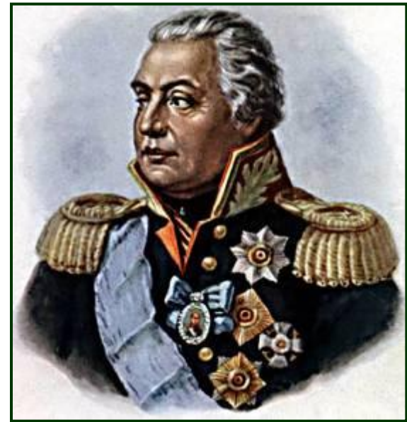
Михаил Илларионович Кутузов (1745 – 1813)

Он родился 5 сентября 1745 г. в Петербурге. В 1757 г. был определен в инженерно-артиллерийскую школу, а 1 января 1761 г. произведен в прапорщики.