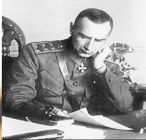
Верховный Правитель России и Верховный Главнокомандующий Русской армией адмирал А. В. Колчак