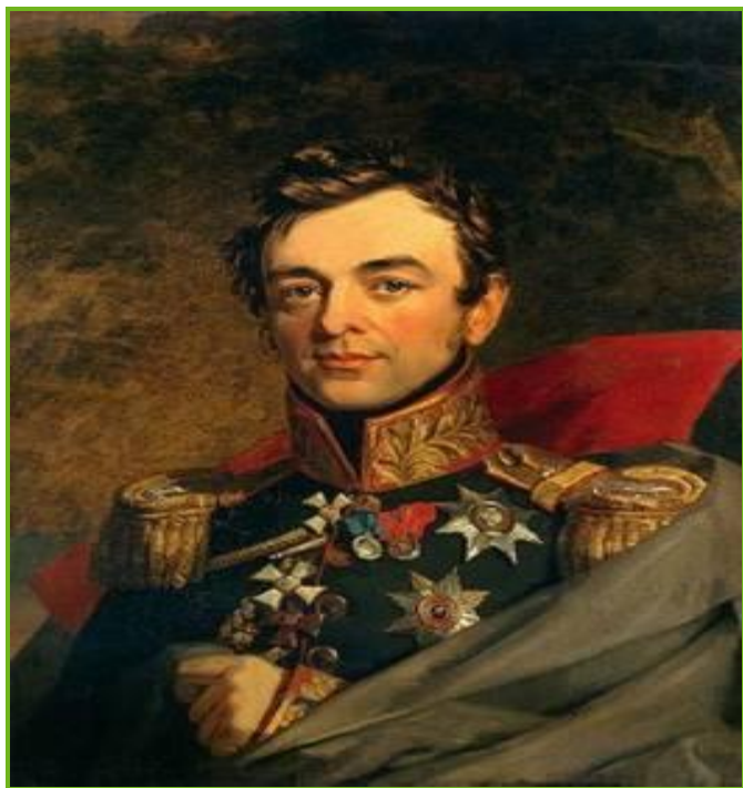
Иван Федорович Паскевич