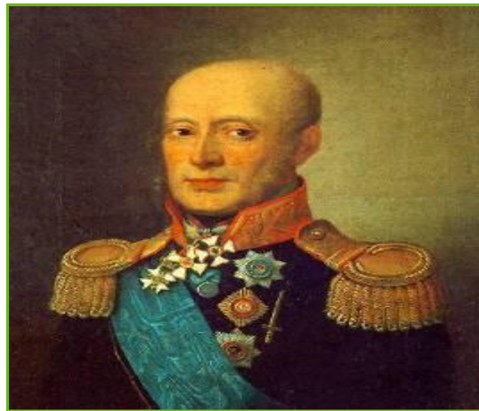
Михаил Богданович Барклай-де-Толли