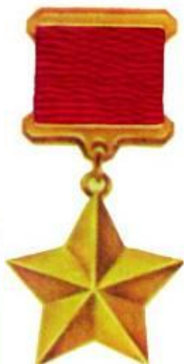
Звезда Героя Советского Союза