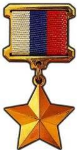
Звезда Героя Российской Федерации