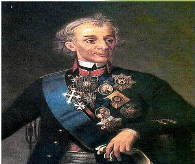
Алекса́ндр Васи́льевич Суво́ров