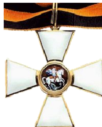
Орден Святого Георгия