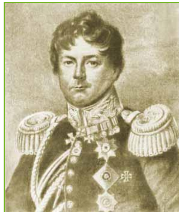
Иван Иванович Дибич-Забалканский (1785 - 1831)

Генерал-фельдмаршал, граф, участник войн с Францией 1805 - 1807 гг. и Отечественной войны 1812 г. Во время заграничного похода Русской армии 1813-1814 гг. - оберквартирмейстер корпуса, генерал-квартирмейстер армии и союзных русско-прусских войск. С 1815 г. - начальник штаба 1-й армии, с 1823 г. - начальник Главного штаба. В русско-турецкую войну 1828 - 1829 гг. - главнокомандующий Русской армией.