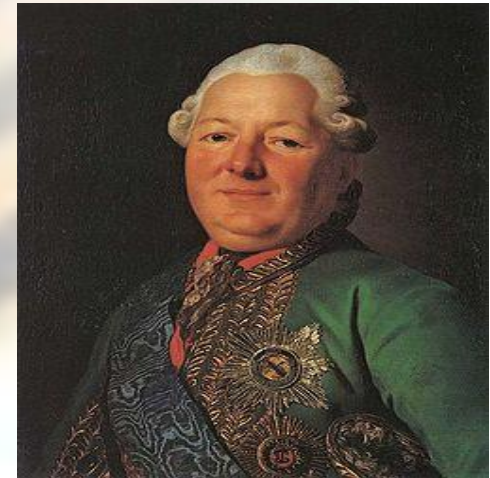
Васи́лий Миха́йлович Долгору́ков-Кры́мский