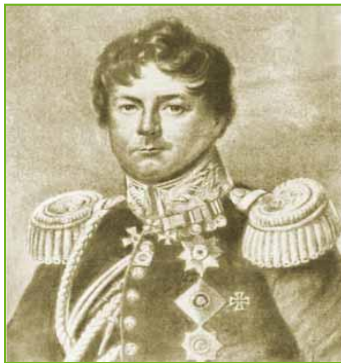
Иван Иванович Дибич-Забалканский