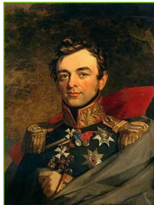
Иван Федорович Паскевич (1782 -1856)

Первый боевой поход Паскевич совершил в 1805 г., но настоящую боевую выучку получил во время русско-турецкой войны 1806 - 1812 гг. Он за пять лет прошел путь от капитана до генерал-майора. Паскевич был участником многих сражений этой войны, а в 1810 г. за овладение вражескими батареями на мысе Галотбург в ходе осады крепости Варны заслужил свой первый орден Святого Георгия четвертой степени.