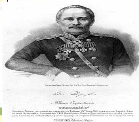
Генерал-майор И. Е. Тихоцкий