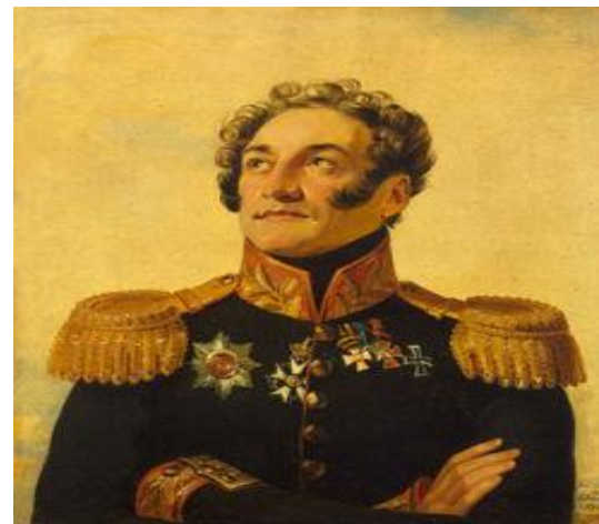
Плато́н Ива́нович Кабуко́в (1779 – 1835) -- генерал-лейтенант, участник войны 1812 года.