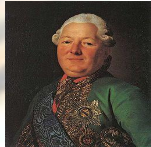
Васи́лий Михаи́лович Долгору́ков-Кры́мский