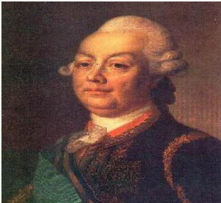
Пётр Александрович Румя́нцев-Задуна́йский