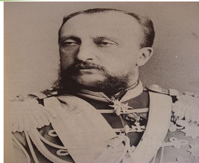
Великий князь Никола́й Никола́евич Ста́рший