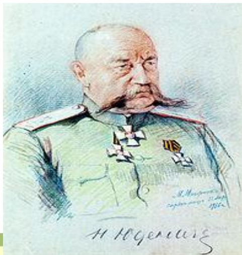
Генерал Н. Н. Юденич