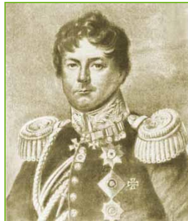
Иван Иванович Дибич-Забалканский (1785 - 1831)

Генерал-фельдмаршал, граф, участник войн с Францией 1805 - 1807 гг. и Отечественной войны 1812 г. Во время заграничного похода Русской армии 1813-1814 гг. - оберквартирмейстер корпуса, генерал-квартирмейстер армии и союзных русско-прусских войск. С 1815 г. - начальник штаба 1-й армии, с 1823 г. - начальник Главного штаба. В русско-турецкую войну 1828 - 1829 гг. - главнокомандующий Русской армией.