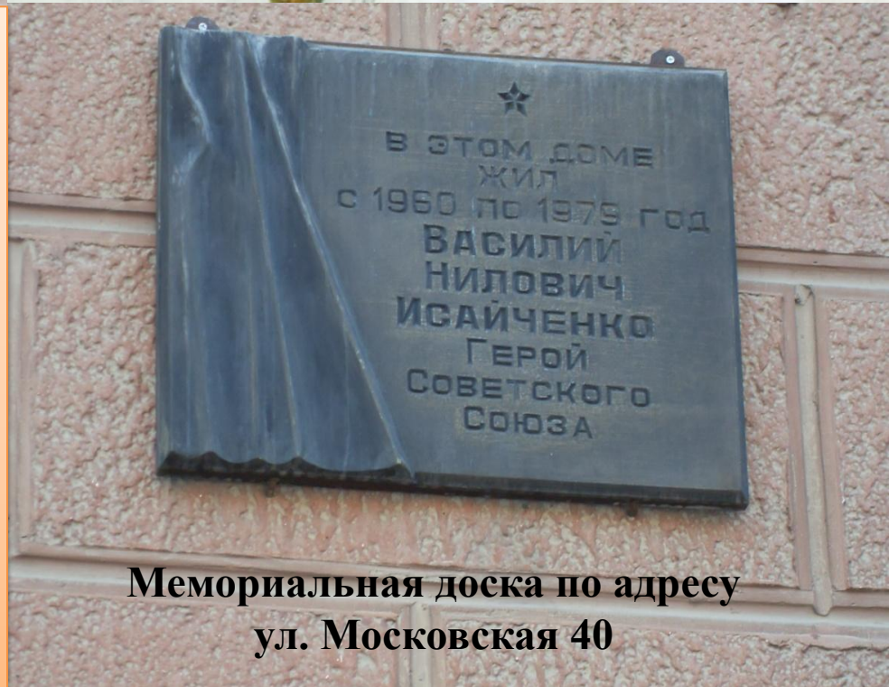
Мемориальная доска по адресу ул. Московская 40

В 2009 году в МОУ «Средняя общеобразовательная школа № 8 г. Юрги» был разработан проект «Память Ваш подвиг хранит», который победил в областном конкурсе социально-значимых проектов. Он предусматривает создание аллеи «Память Героям». На этой аллее будет мемориальная