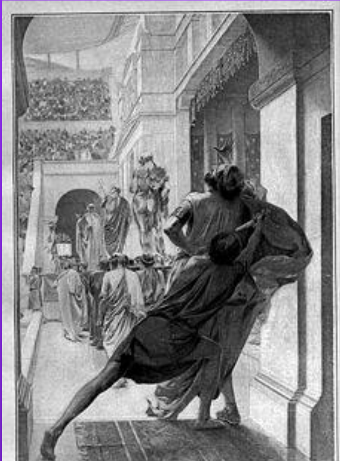
Убийство Филиппа Павсанием