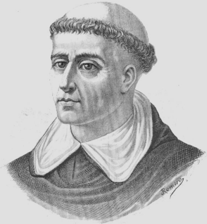
Томас Торквемада – глава испанской инквизиции