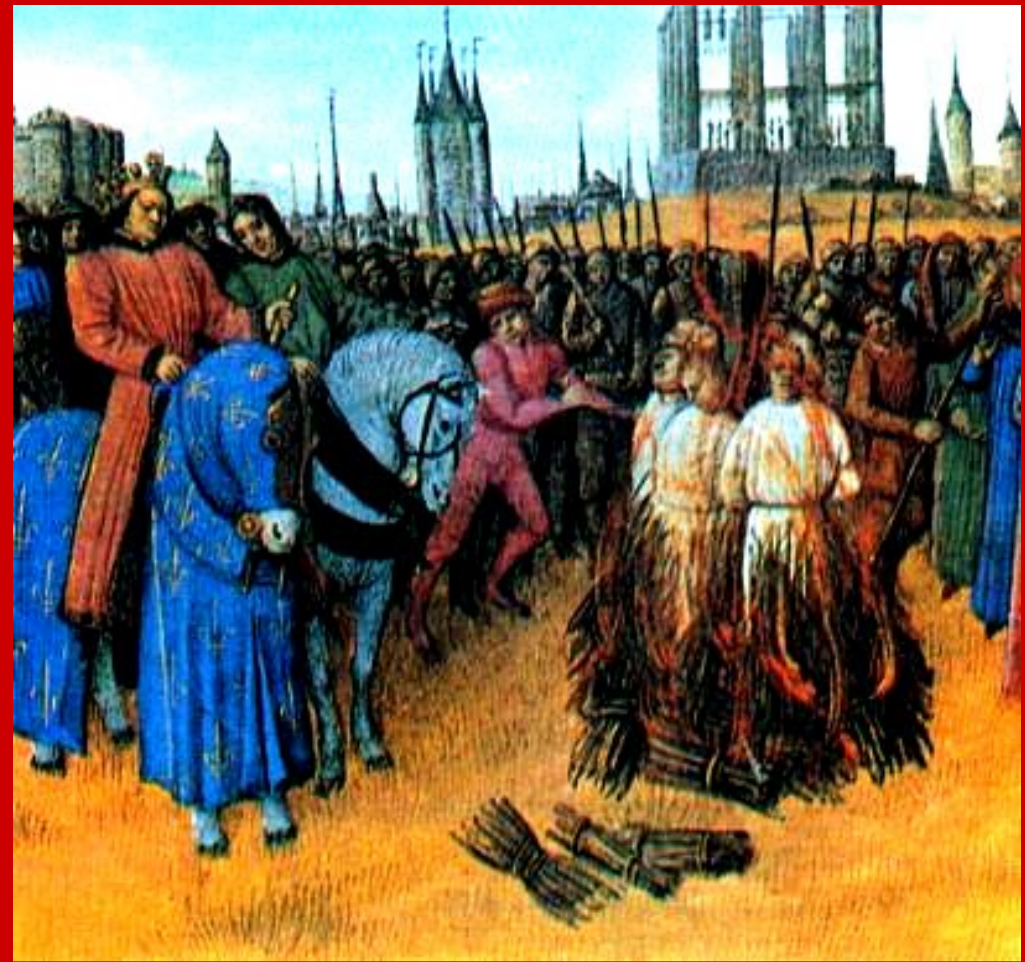
Аутодафе («дело веры») - сожжение еретиков.