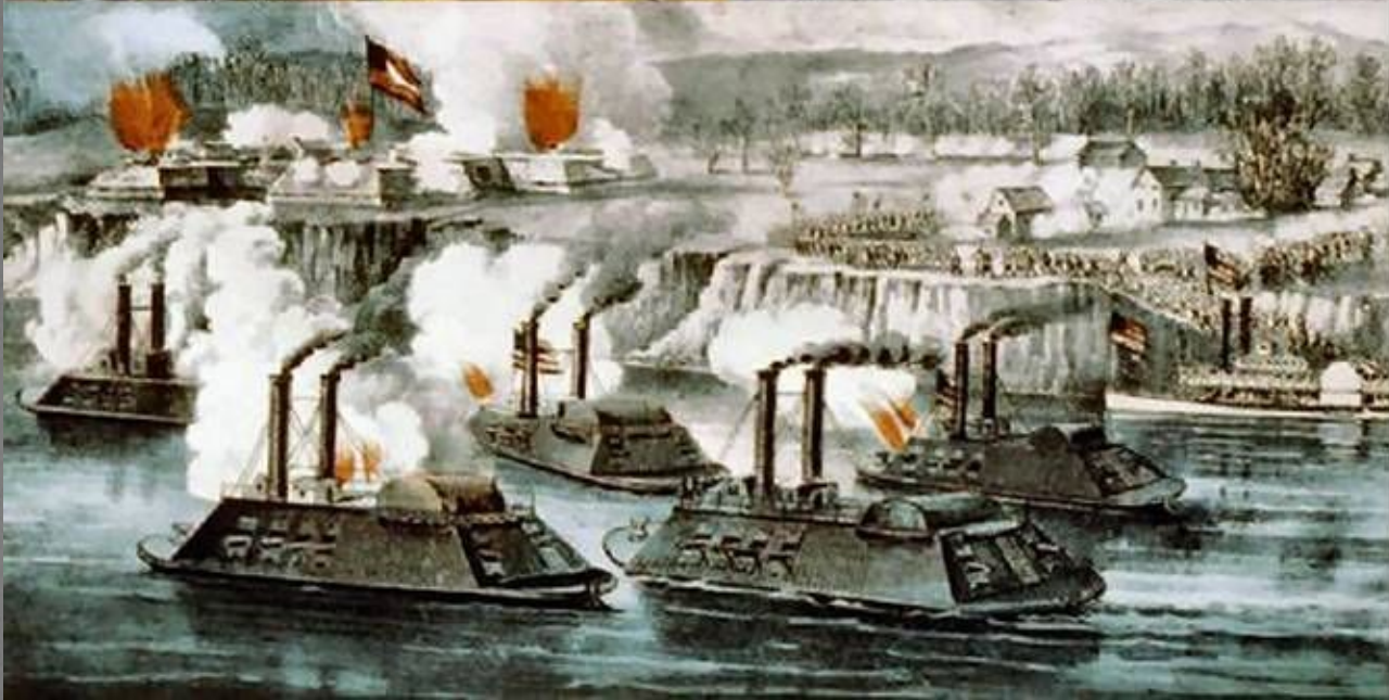
В июле 1863 г. В ходе войны армия генерала Ли была разгромлена и начинала отступления в битве под Геттисбергом.