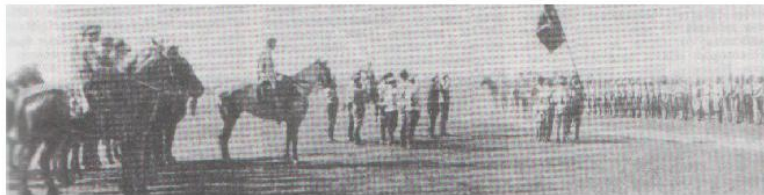
Вручение Красного знамени ВЦИК Латвийской стрелковой дивизии за участие в разгроме армии Деникина. Берислав, 2 августа 1920 года.