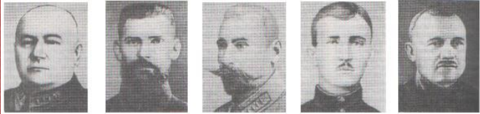
И.И.Вацетис. Р.И. Берзинь. Я.Ф.Фабрицус. В.М. Азин. Г.Х.Эйхе.