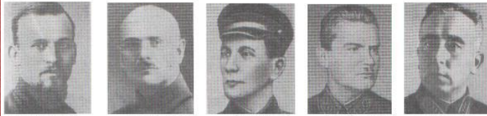
Э.П.Берзинь. Ф.К.Калнинь. И.Я.Строд. Р.П.Эйдеман. Я.Я.Лацис.