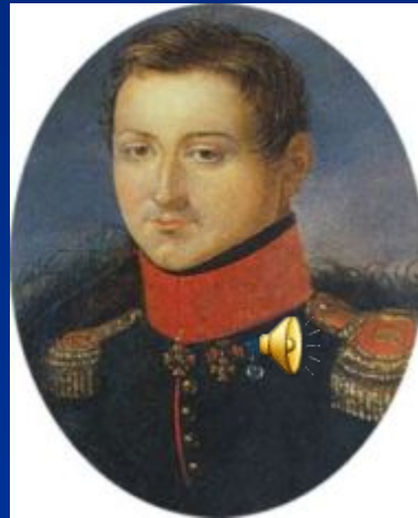
С. И. Муравьев-Апостол.