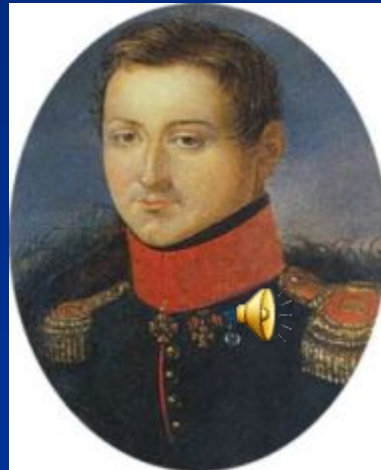
С. И. Муравьев-Апостол.