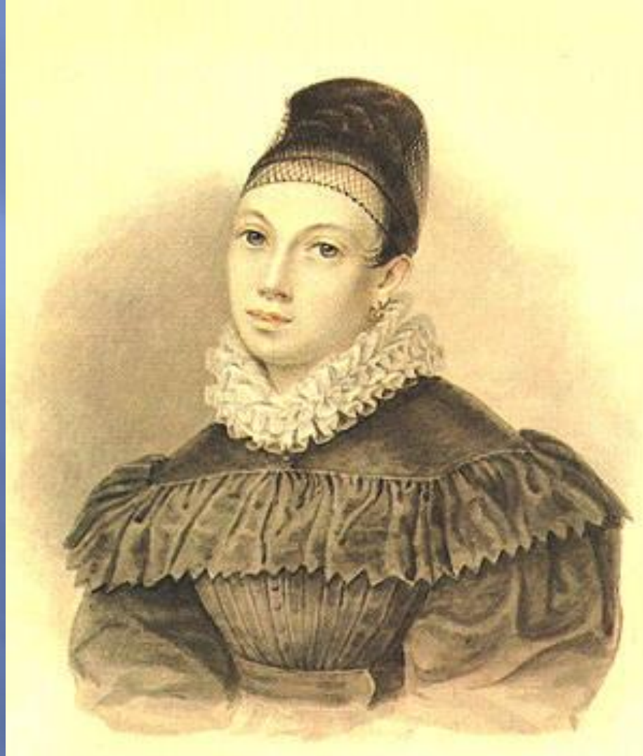
Портрет Е.П. Нарышкиной. 1832 г.