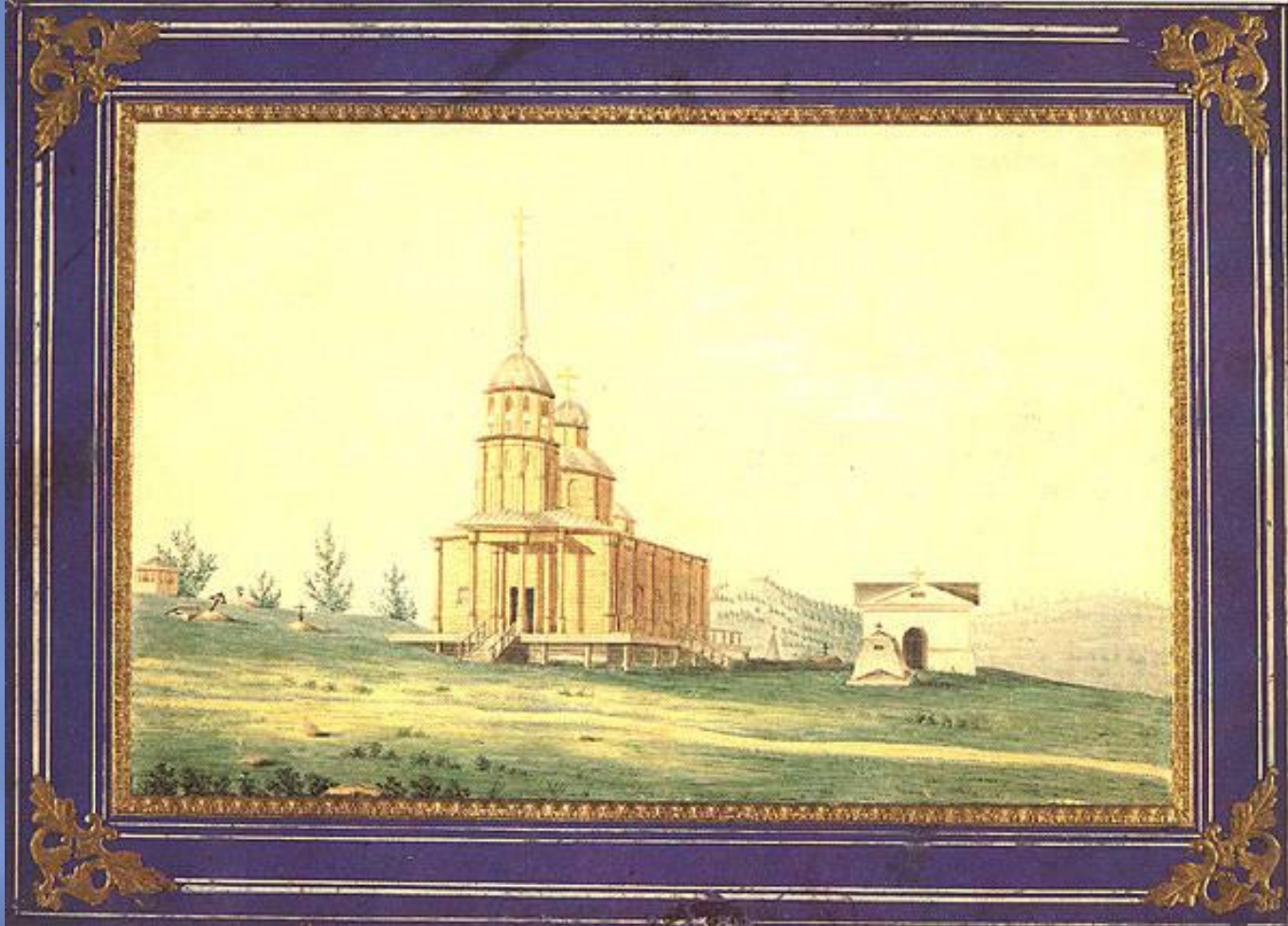
Церковь и могила А.Г.Муравьёвой в Петровском заводе. 1834 – 1839 гг.