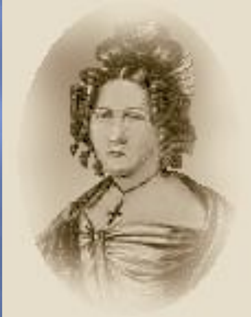
АННЕНКОВА (Гебль) Прасковья (Полина) Егоровна (09.06.1800 - 14.09.1876)