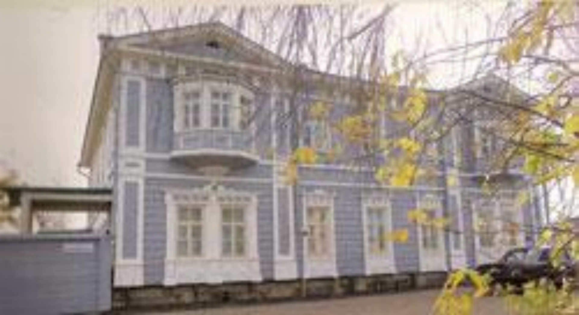
Усадьба декабриста князя Сергея Григорьевича Волконского в Иркутске