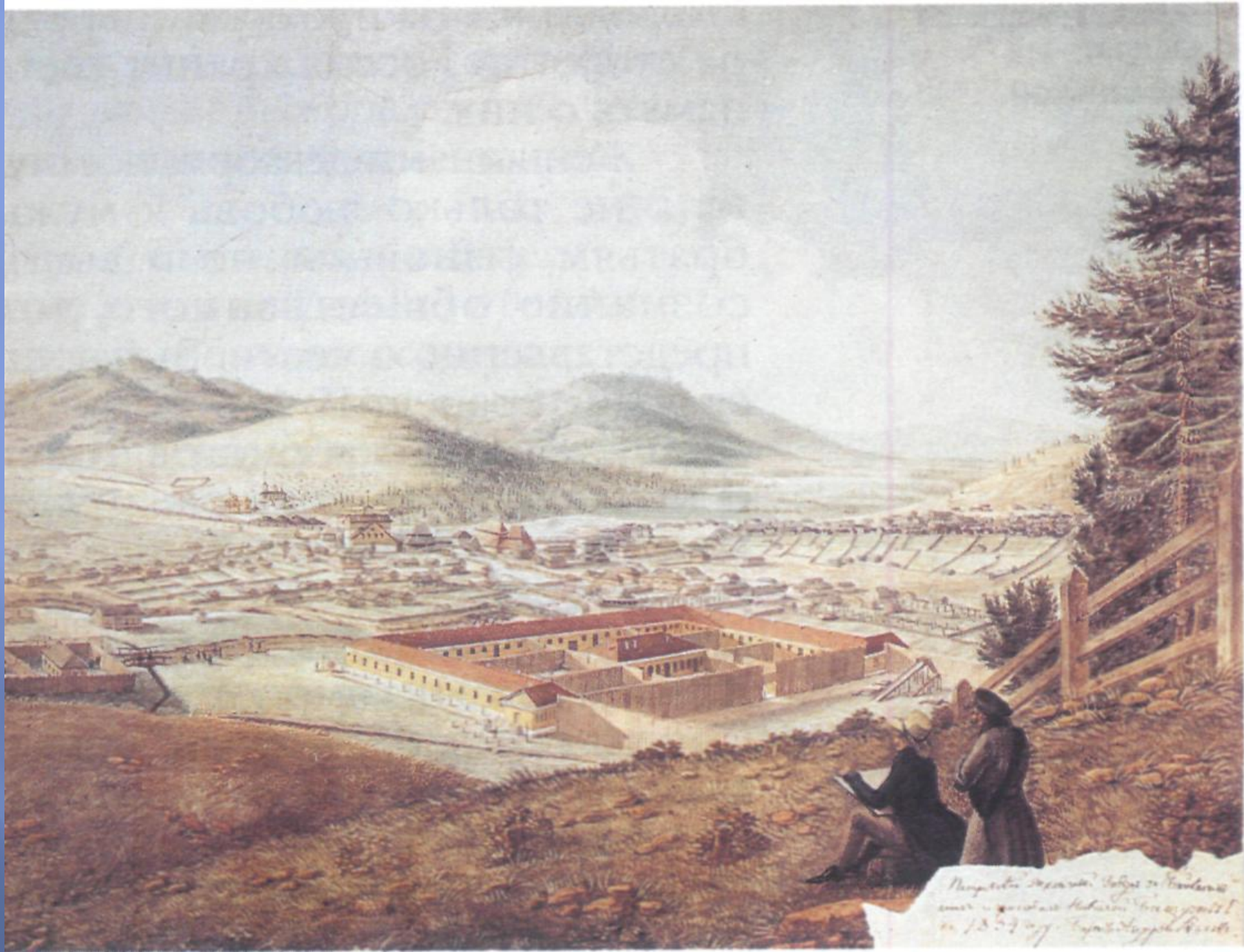
Вид Петровского завода