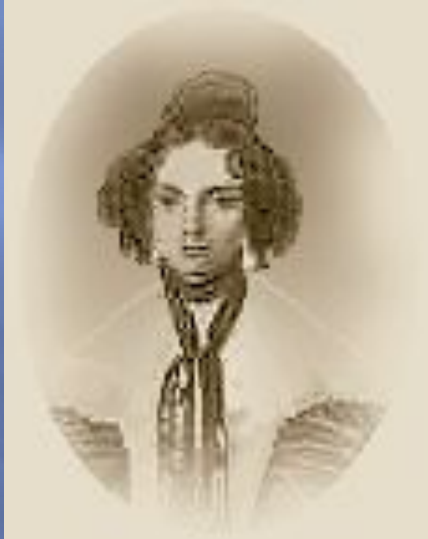
ВОЛКОНСКАЯ (Раевская) Мария Николаевна (25.12.1805/7 - 10.08.1863)