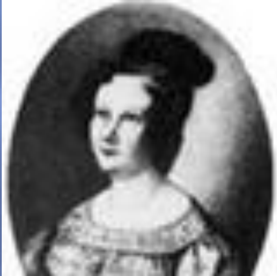
ТРУБЕЦКАЯ (Лаваль) Екатерина Ивановна (1800-1854)