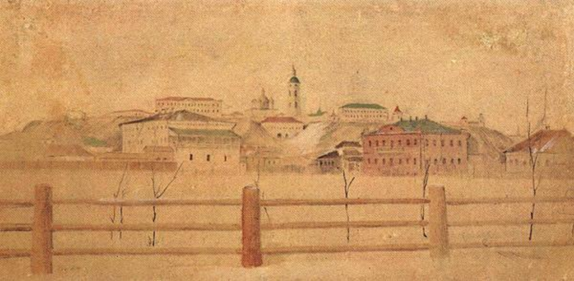
Неизвестный художник-декабрист. Вид Тобольска. 1830-е гг.