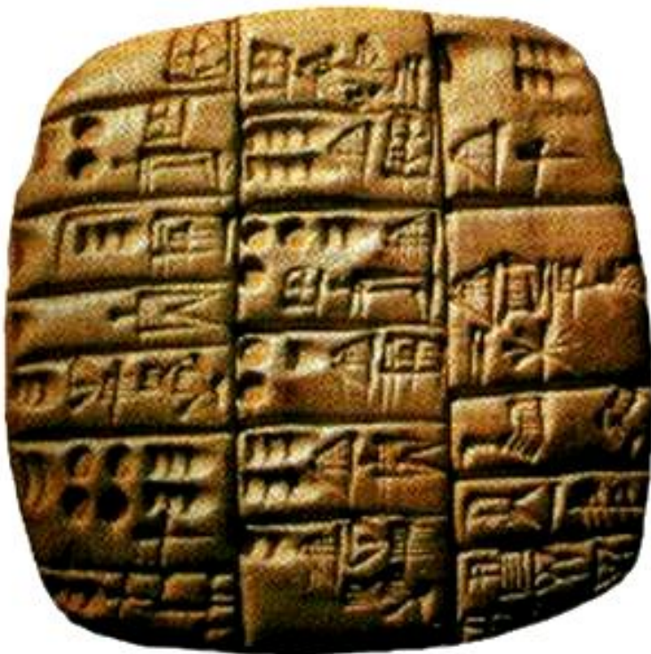
Глиняная табличка с образцом клинописи.

В Двуречье до сих пор находят глиняные таблички покрытые клинописью.