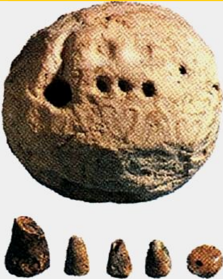
Табличка для счета.

Во главе школы стоял «отец». Ему помогали старшекласник-«старший брат» и «человек с палкой».