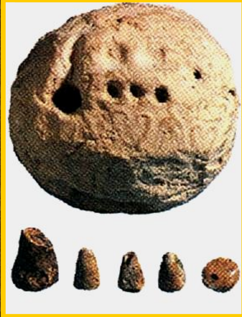
Табличка для счета.

Во главе школы стоял «отец». Ему помогали старшекласник-«старший брат» и «человек с палкой».