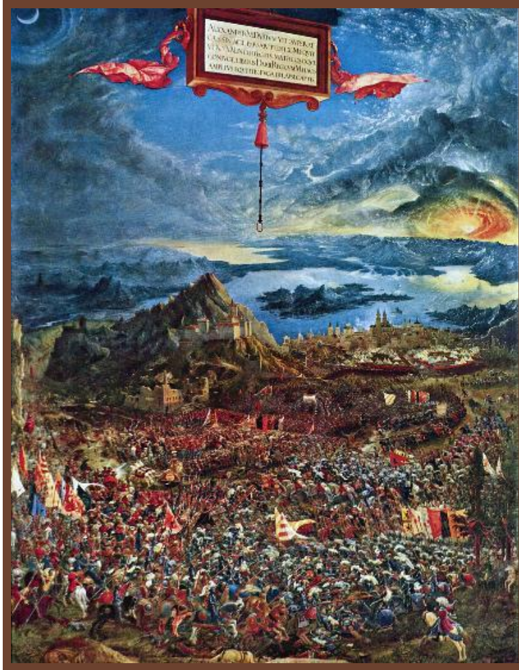
Альбрехт Альтдорфер. Битва Александра Македонского с Дарием

Дарий I – (522 – 486 гг. до н. э.) . 20 округов – Сатрапы (суд, налоги, дороги, каналы и т. д). Армия – военачальник. Единая монета – золотой дарик.