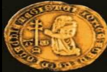
Печать Фердинанда Эредна, великого магистра госпитальеров ордена Святого Иоанна Иерусалимского (1384 г.). Орден, уже оставивший Иерусалим (1187 г.), Сен-Жанд'Акр (1291 г.), а затем и Кипр, с 1309 года расположился на острове Родос.