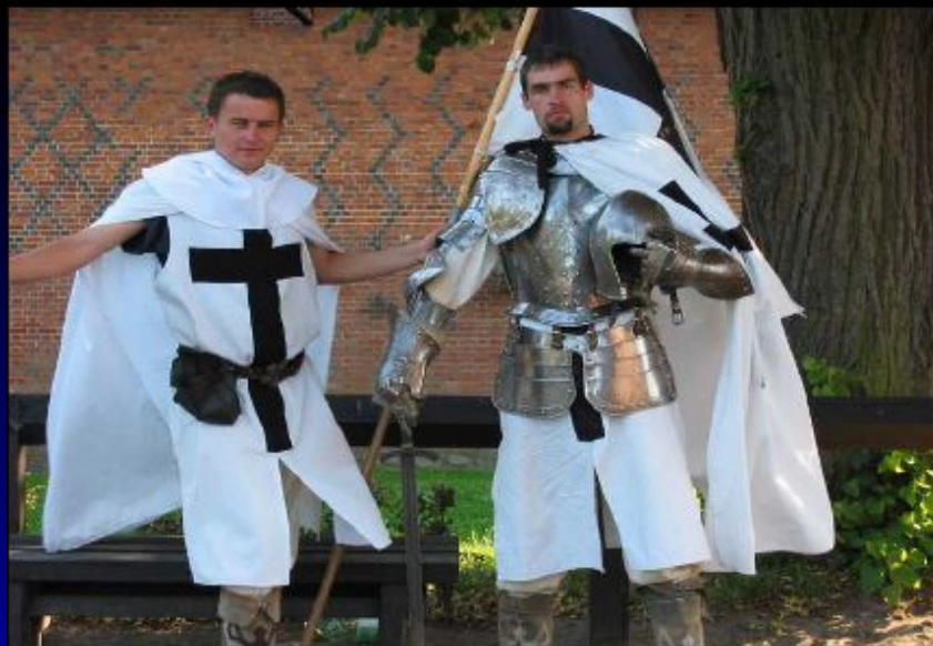
Шоур-реконструкция кавалерийцев Тевтонского ордена.