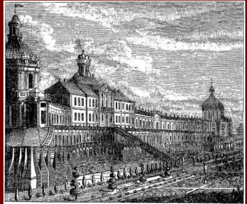
Петербург 18 в.