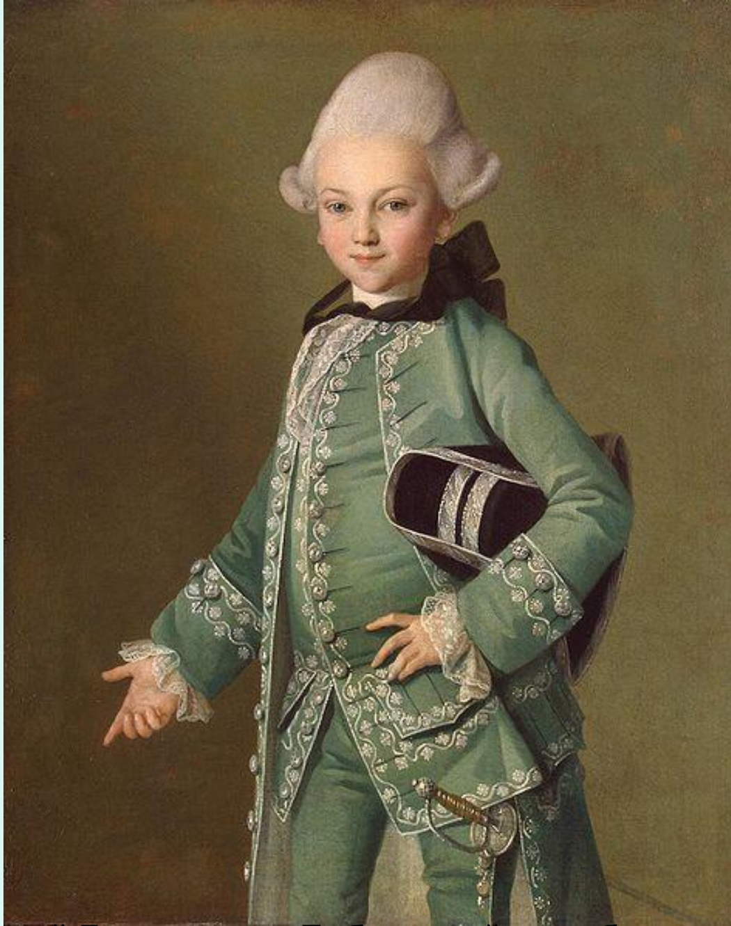
Алексей Григорьевич Бобринский – внебрачный сын императрицы