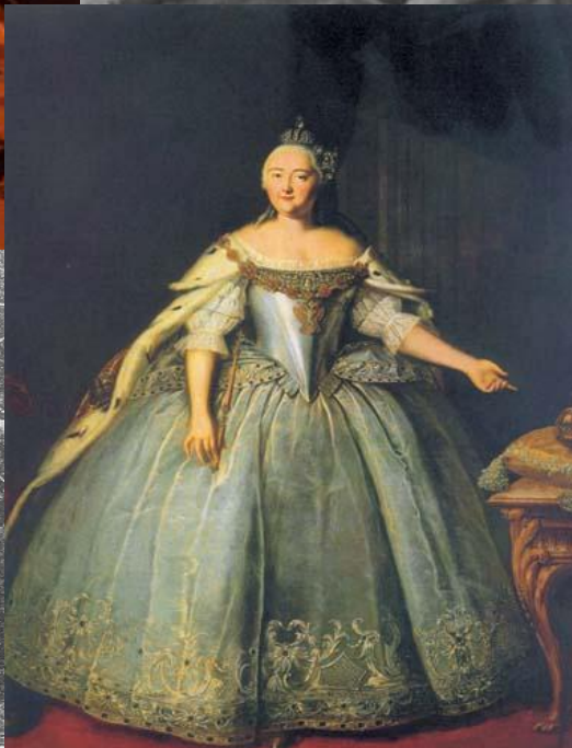
ЕЛИЗАВЕТЪ I Императрица и Самодержавица Всероссийская ELISABETH I Russorum Imperatrix