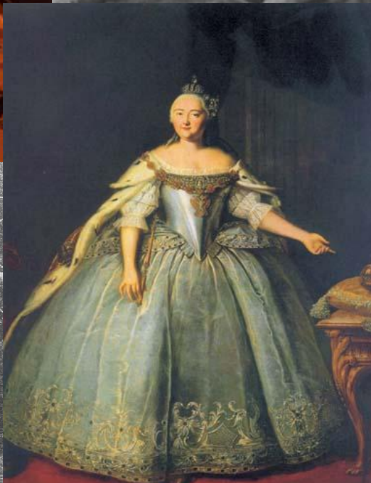
ЕЛИЗАВЕТЪ I Императрица и Самодержавица Всероссийская. ELISABETH I Russoorum Imperatrix