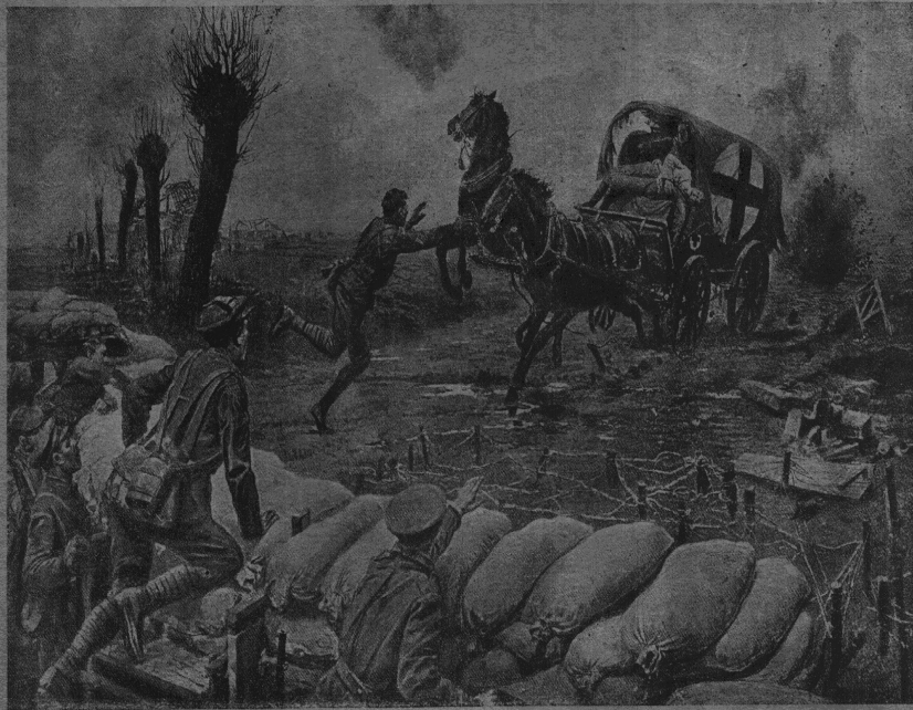
Обстрел повозки Красного Креста.