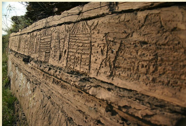
Малая Боярская писаница