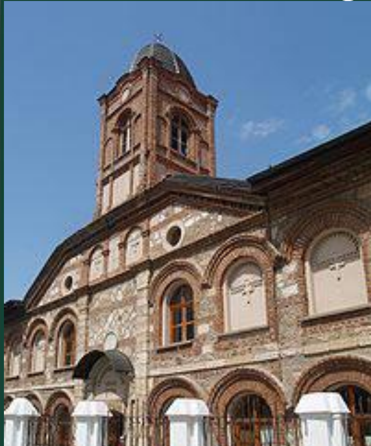
Болгарская церковь Святого Георгия

Убедившись в слабости Балканских стран, османы перешли от набегов к завоеваниям. Захватив значительную часть византийских владений в Европе, они перенесли свою столицу в Адрианополь. Император должен был признать султана вассалом и платить ему дань.