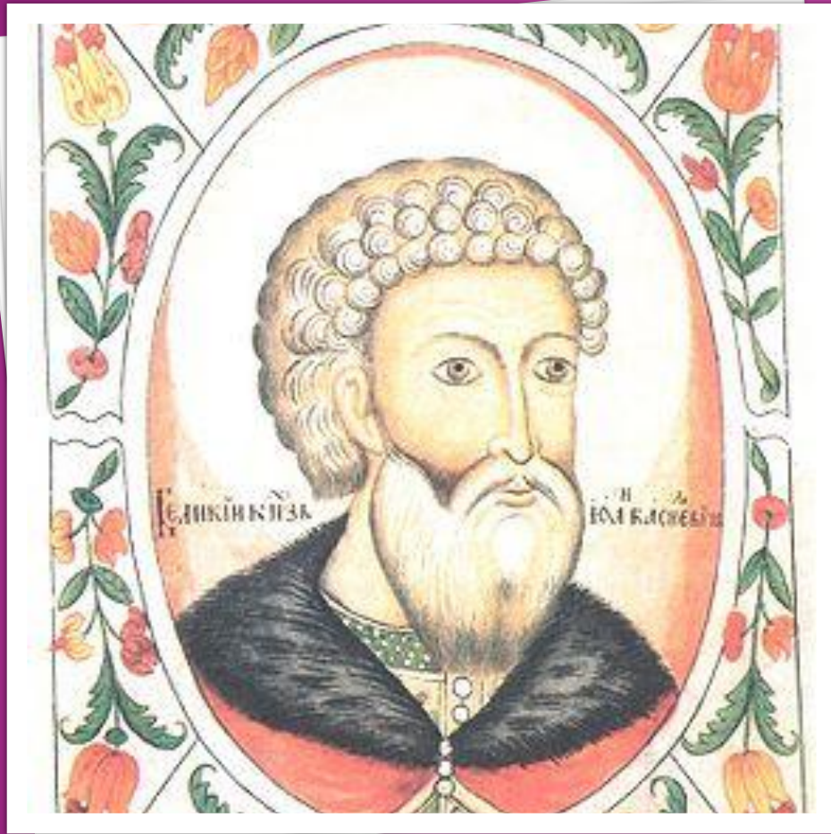
Портрет из «Царского титулярника» (XVII век).