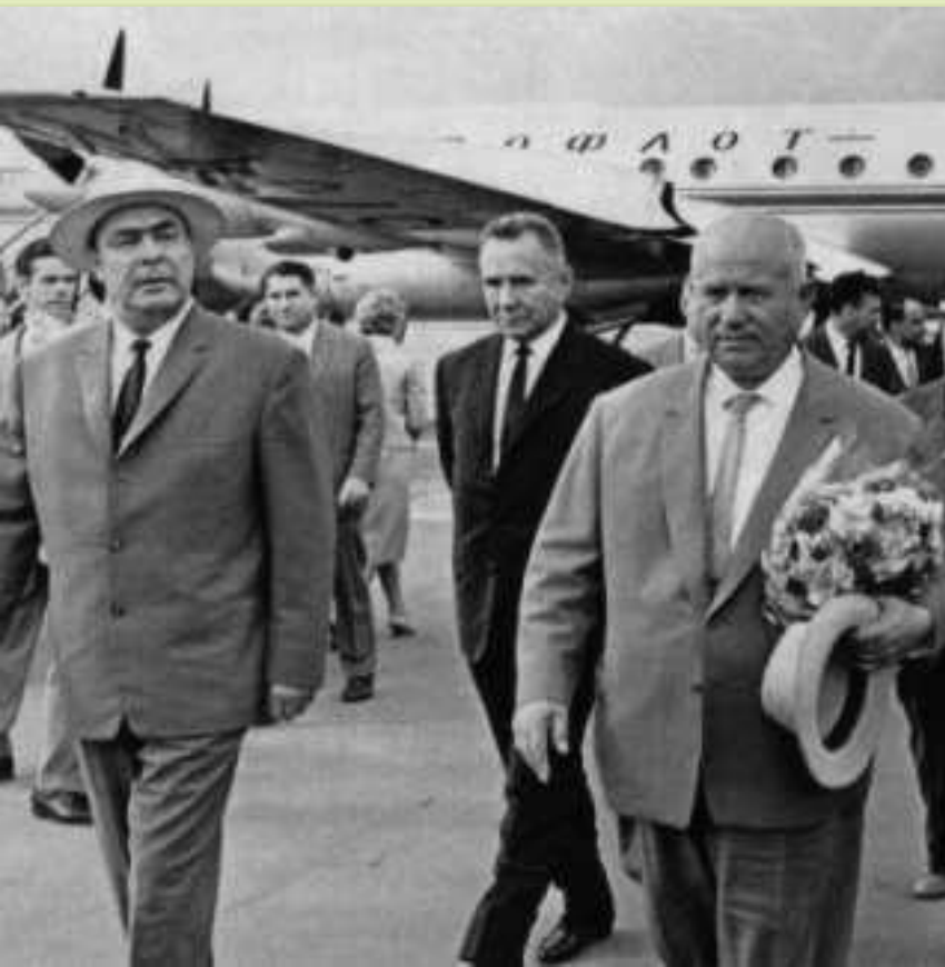
Л.И. Брежнев и Н.С. Хрущёв

В октябре 1964 года Хрущёв был обвинён в «волюнтаризме и субъективизме», отстранён от руководства партией и страной и отправлен на пенсию. Первым секретарём ЦК КПСС был избран Л.И. Брежнев, председателем Совмина стал Косыгин А.Н.