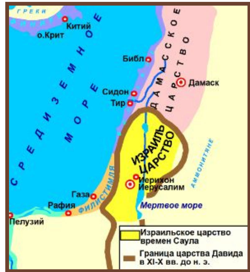
Израиль в древности

В первой половине I тысячелетия до н. э. новое политическое образование сложилось и на юге Восточного Средиземноморья. В XIII в. до н. э. племенной союз двенадцати древнееврейских племен, именуемых коленами, вторгся на территорию Палестины и подчинил себе ряд местных ханаанейских городов-государств.