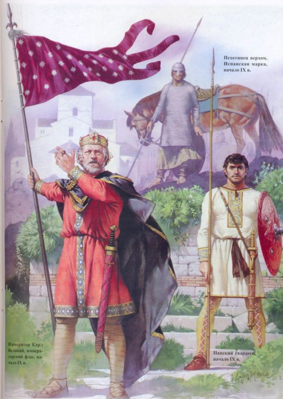
Император Карл Великий, императорский флаг, начало IX в.

Каролинги очень хотели, чтобы ни у кого не оставалось сомнений в их законном праве владеть престолом.