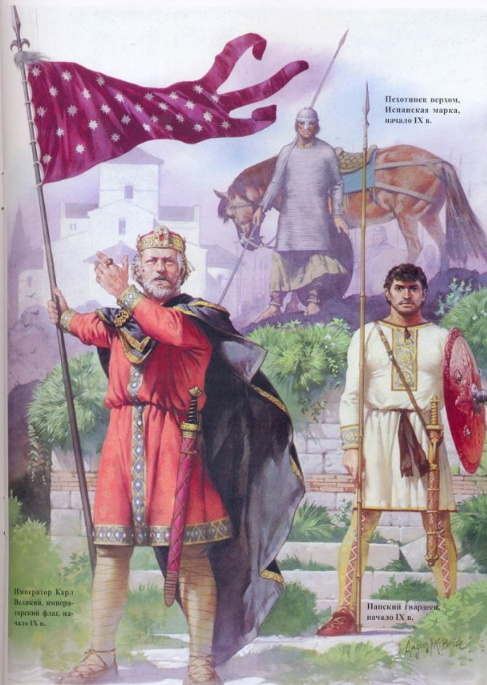
Пехотинец верхом, Испанская марка, начало IX в.

Каролинги очень хотели, чтобы ни у кого не оставалось сомнений в их законном праве владеть престолом.