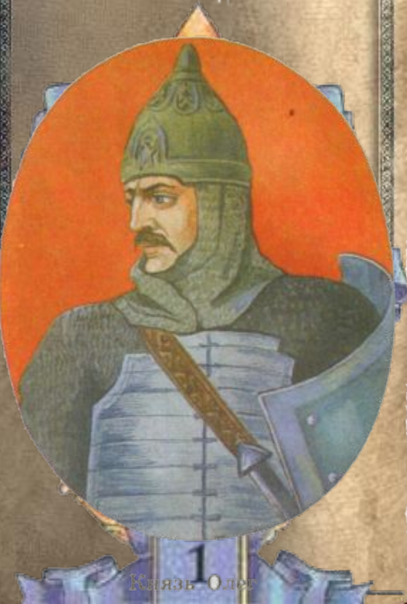
1 Князь Олег